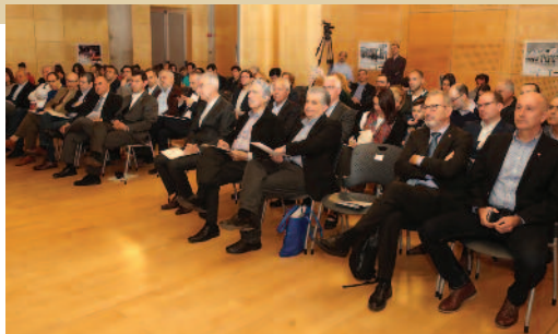
Περίπου 150 σύνεδροι συμμετείχαν στην 31η Σύνοδο.