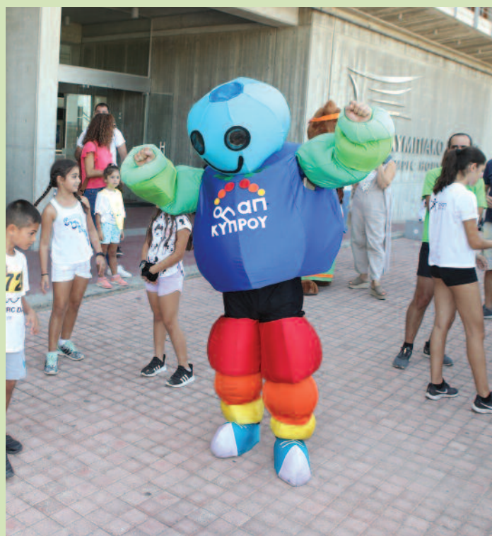
Καθοριστική για την ΚΟΕ η στήριξη των χορηγών της.