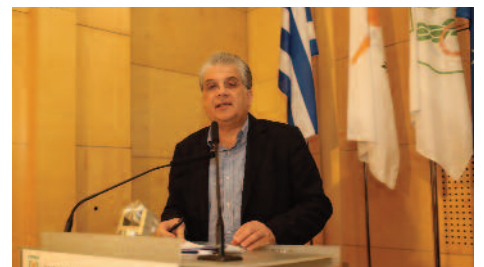
Ο πρώην Υπουργός Παιδείας και νυν πρύτανης του Frederick Δρ. Γεώργιος Δημοσθένους.