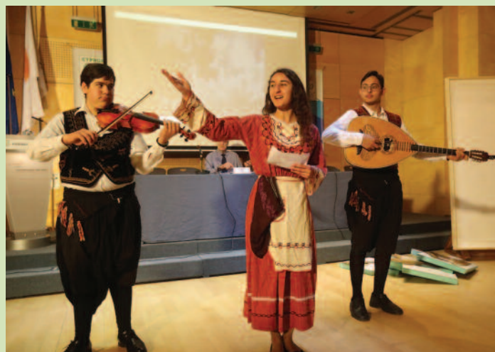
Τα σχολεία από Κύπρο και Ελλάδα ενθουσίασαν το κοινό με την ευρηματικότητα τους στο 8ο Μαθητικό Συνέδριο "Pierre de Coubertin".

τον τέως Υπουργό Παιδείας Δρ. Κώστα Χαμψιαούρη να τελεί τα εγκαίνια.