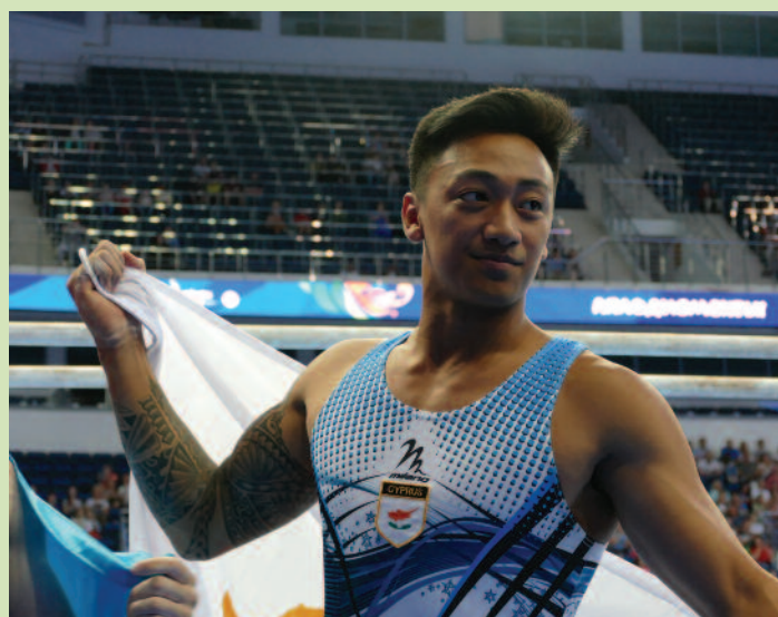
Ο Μάριος Γεωργίου κατέκτησε το μοναδικό μετάλλιο της Κύπρου στους 2ους Ευρωπαϊκούς Αγώνες στο Μινσκ, το αργυρό στο δίζυγο.

Αρκετές ήταν και οι εκδόσεις που εξέδωσε η ΚΟΕ, οι οποίες αποτελούν σημαντικό εργαλείο για διάδοση των Αρχών και Αξιών του Ολυμπισμού και των δράσεων της ΚΟΕ. Κάθε μήνα κυκλοφορεί το περιοδικό με τίτλο «Ολυμπιακά Νέα», και κάθε δύο μήνες το newsletter στην αγγλική γλώσσα. Από κει και πέρα, εκδόθηκε ο «Οδηγός Ολυμπιακής Παιδείας» για δασκάλους και καθηγητές, το έντυπο με τίτλο «Γνωρίστε τα 33 Ολυμπιακά αθλήματα», το οποίο