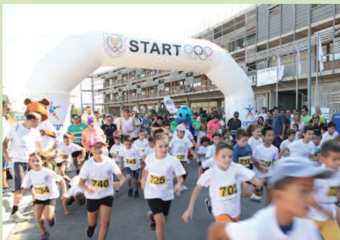
Μαζική ήταν η συμμετοχή του κοινού στους εορτασμούς της Ολυμπιακής Ημέρας.