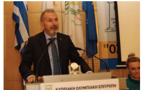
Ο επίτιμος κοσμήτορας της Διεθνούς Ολυμπιακής Ακαδημίας Δρ. Κώστας Γεωργιάδης.