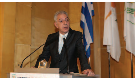
Ο ΥΠΠΑΝ κ. Πρόδρομος Προδρόμος.