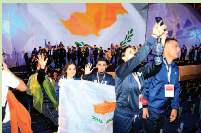
Η Κυπριακή αποστολή στην τελετή έναρξης των ΑΜΚΕ στο Μαυροβούνιο.

θα κυκλοφορήσει στα δημοτικά σχολεία, καθώς και το έντυπο «Ολυμπιακές Εξερευνησεις» με εκπαιδευτικά παιχνίδια για τα παιδιά. Μεταφράστηκε επίσης στα ελληνικά το έντυπο της UNICEF «Δικαιώματα των Παιδιών στον Αθλητισμό», ενώ ετοιμάστηκαν και τα λευκώματα των διαφόρων συνόδων και συνεδρίων.