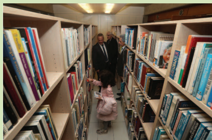
Σημαντική στιγμή ήταν τα εγκαίνια της Κυπριακής Ολυμπιακής Βιβλιοθήκης.

Για να γίνουν κατορθωτά τα πιο πάνω, αλλά και για την καθημερινή λειτουργία της Ολυμπιακής Επιτροπής, καθοριστική ήταν η συμβολή και στήριξη των θεσμικών φορέων και χορηγών της ΚΟΕ. Αυτοί είναι το Υπουργείο Παιδείας, Πολιτισμού, Αθλητισμού και Νεολαίας, ο Διαχρονικός Χορηγός ΟΠΑΠ Κύπρου, οι Μέγα Χορηγοί RCB, Carbo One και Χαραλαμπίδης Κρίστης. Και οι Επίσημοι Χορηγοί Cyta, Toyota και Υπεραγορές ΜΕΤΡΟ.