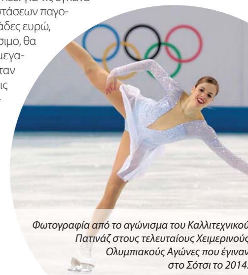
Φωτογραφία από το αγώνισμα του Καλλιτεχνικού Πατινάζ στους τελευταίους Χειμερινούς Ολυμπιακούς Αγώνες που έγιναν στο Σότσι το 2014.