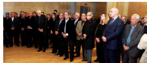
Οι άνθρωποι του αθλητισμού παραβρέθηκαν στην εκδήλωση Κοπής της Βασιλόπιτας της ΚΟΕ.