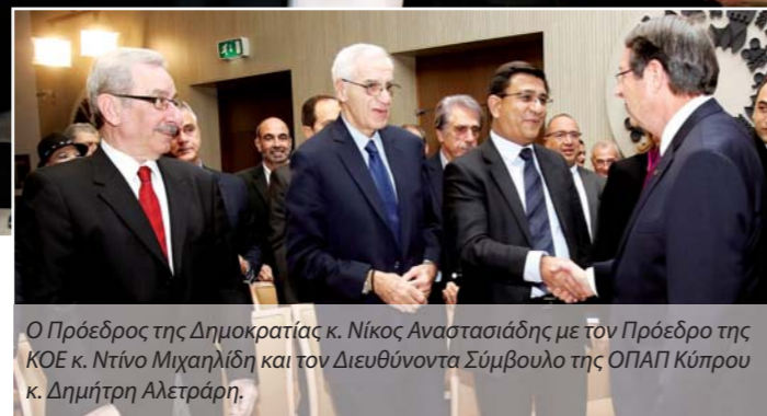
Ο Πρόεδρος της Δημοκρατίας κ. Νίκος Αναστασιάδης με τον Πρόεδρο της ΚΟΕ κ. Ντίνο Μιχαηλίδη και τον Διευθύνοντα Σύμβουλο της ΟΠΑΠ Κύπρου κ. Δημήτρη Αλετράρη.

Πραγματοποιήθηκε στις 20 Δεκεμβρίου στο Προεδρικό Μέγαρο στην παρουσία του Προέδρου της Δημοκρατίας κ. Νίκου Αναστασιάδη, εκδήλωση προς τιμήν της Ολυμπιακής ομάδας που συμμετείχε στους Ολυμπιακούς Αγώνες «Ρίο 2016».