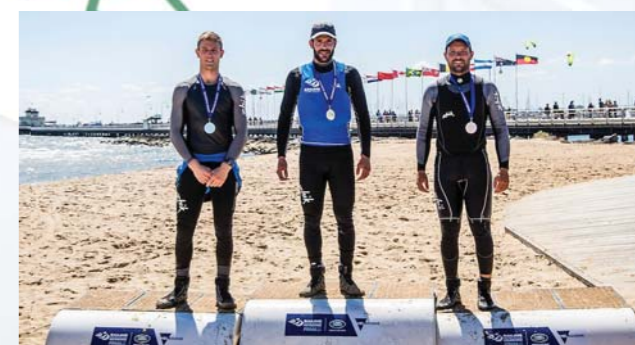
Ο Παύλος Κοντίδης στο βάθρο των νικητών στον τελικό του Παγκοσμίου Κυπέλλου που έγινε στη Μελβούρνη τον περασμένο Δεκέβρη.