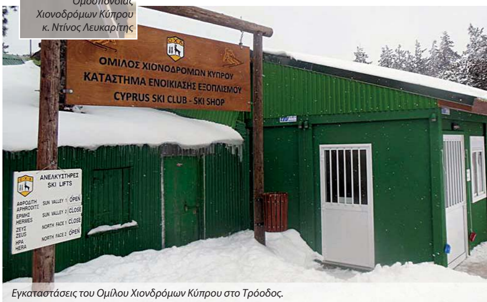
Εγκαταστάσεις του Ομίλου Χιονοδρόμων Κύπρου στο Τρόδος.

Στο Τρόδος υπάρχουν τέσσερις χιονοδρομικές πίστες, τα Sun Valley 1 και 2, η Ήρα και το North Face. Οι εγκαταστάσεις στο βουνό έχουν ανανεωθεί πρόσφατα και περιλαμβάνουν καφετέρια και κατάστημα σκι. Εκατοντάδες είναι τα άτομα που τα χρησιμοποιούν, αφού τη χειμερινή περίοδο αρκετοί είναι οι ερασιτέχνες που επιλέγουν να ανέβουν στο Τρόδος και να διασκεδάσουν με σκι. Οι αρχάριοι έχουν τη δυνατότητα να νοικιάσουν εξοπλισμό και να κάνουν και μαθήματα με προπονητές. Πληροφορίες υπάρχουν στην ιστοσελίδα της Ομοσπονδίας Χιονοδρόμων Κύπρου στο www.cyprusski.com .