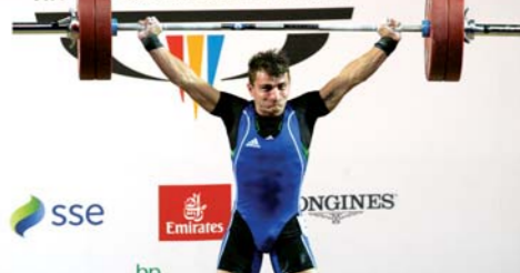
Ο Δημήτρης Μινασίδης, κορυφαίος Κύπριος αρσιβαρίστας, θέλει να επιστρέψει στον δρόμο των επιτυχιών το 2017