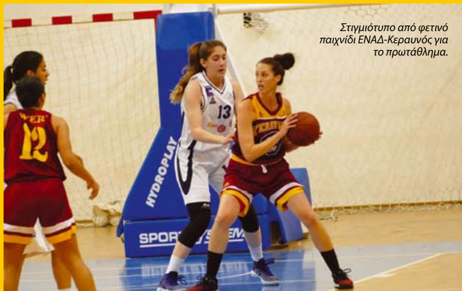
Στιγμιότυπο από φετινό παιχνίδι ΕΝΑΔ-Κεραυνός για το πρωτάθλημα.

Για δεύτερη συνεχόμενη χρονιά οι γυναίκες ομάδες του Κεραυνού και της ΕΝΑΔ θα αναμετρηθούν στον τελικό του κυπέλλου, την Κυριακή 18 Μαρτίου στο Λευκόθεο. Την περσινή σεζόν (2016/17) ο Κεραυνός κατέκτησε το νταμπλ, κερδίζοντας την ΕΝΑΔ στον τελικό κυπέλλου με 54-41. Οι δύο ομάδες είχαν αναμετρηθεί στον τελικό το 2000 (νίκη για Κεραυνό με 55-53) και το 1994 (νίκη για ΕΝΑΔ με 68-62). Ο Κεραυνός μετράει εννιά κύπελλα (1999, 2000, 2001, 2002, 2003, 2004, 2005, 2013, 2017) και η ΕΝΑΔ δύο (1988, 1994).