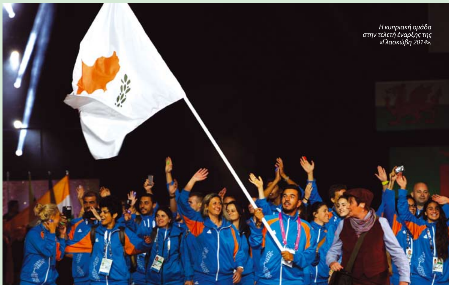
Η κυπριακή ομάδα στην τελετή έναρξης της «Γλασκώβη 2014».

Από τα τέλη Μαρτίου 2018 θα αρχίσουν να καταφτάνουν στην πόλη Gold Coast, στην πολιτεία της Queensland στην ανατολική ακτή της Αυστραλίας, οι αθλητές, προπονητές, δημοσιογράφοι και διοικητικό προσωπικό της Κυπριακής αποστολής που θα συμμετάσχουν στους 21 ους Κοινοπολιτειακούς Αγώνες που θα ξεκινήσουν στις 4 Απριλίου με την τελετή έναρξης και θα ολοκληρωθούν στις 15 του μήνα.