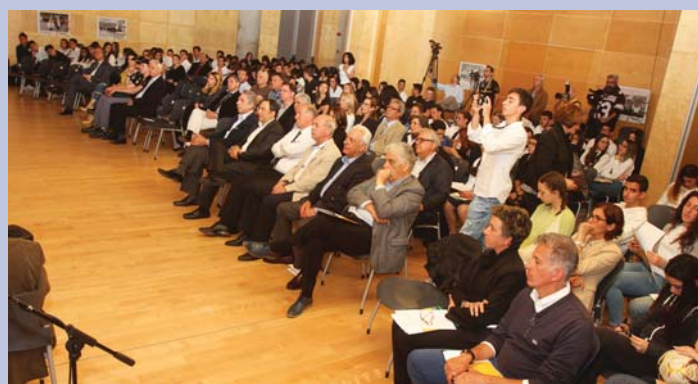
Ο Υπουργός Παιδείας και Πολιτισμού κ. Κώστας Καδής κηρύσσει την έναρξη του 6ου Μαθητικού Συνεδρίου «Pierre de Coubertin»