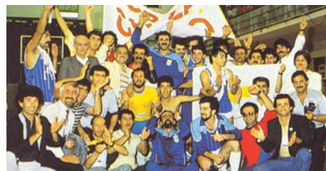
Πανηγυρική φωτογραφία ύστερα από την κατάκτηση του χρυσού μεταλλίου από την ομάδα καλαθόσφαιρας.

Ρεπορτάζ που δημοσιεύτηκε στις εφημερίδες και αφορά στην απόφαση για την δημιουργία της διοργάνωσης των Αγώνων Μικρών Κρατών Ευρώπης.