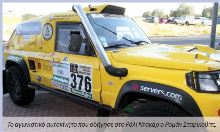
Το αγωνιστικό αυτοκίνητο που οδήγησε στο Ράλι Ντακάρ ο Ρομάν Σταρίκοβιτς.