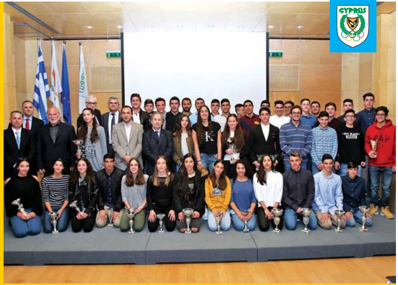
Οι βραβευθέντες αθλητές της Κολύμβησης και της Υδατοσφαίρισης για το 2016 στην τελετή βράβευσης της ΚΟΕΚ στο Ολυμπιακό Μέγαρο.

Στην υδατοσφαίριση η Εθνική Νέων θα μεταβεί στην Τιφλίδα της Γεωργίας όπου θα συμμετάσχει στους προκριματικούς του Ευρωπαϊκού Πρωταθλήματος U17 το οποίο θα διεξαχθεί από 11-14 Μαΐου. Η Κύπρος κληρώθηκε στο 4 ο γκρουπ μαζί με τις ομάδες της Γαλλίας, Ελβετίας, Τσεχίας και Γεωργίας.