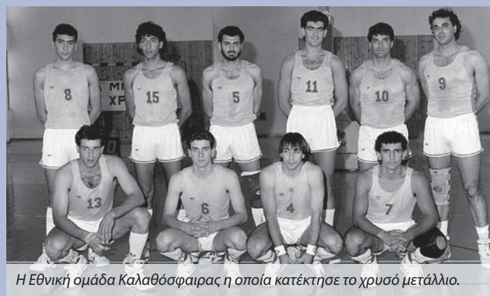
Η Εθνική ομάδα Καλαθόσφαιρας η οποία κατέκτησε το χρυσό μετάλλιο.

Στο μπάσκετ έπεσε αρκετή από την προσοχή της κυπριακής αποστολής. Στις 23 Μαΐου η Κύπρος επικράτησε 91-83 της Μάλτας, αν και έχανε στο α' ημίχρονο με διψήφιο αριθμό πόντων. «Η Μάλτα είχε δύο Αμερικανούς, τον Ντον Ρος (σ.σ. που αγωνίστηκε λίγα χρόνια μετά στην ΕΝΑΔ) και τον Τέρι Φιλ», λέει ο Π. Χατζηχριστοδούλου και συνεχίζει: «Μας διέλυσαν στο α' ημίχρονο. Στο β' ημίχρονο ο Τάκης Λύρας εγκατέλειψε