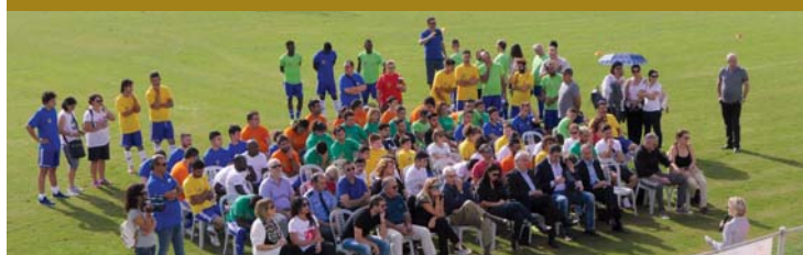
Γενική άποψη της τελετής έναρξης της ημερίδας.

Την Τετάρτη 24 Οκτωβρίου στο γήπεδο της ΠΑΕΕΚ διεξήχθη η Ενοποιημένη Ημερίδα Ποδοσφαίρου, στην οποία έλαβαν μέρος αιτούντες πολιτικού ασύλου που διαμένουν στο Κέντρο Υποδοχής και Φιλοξενίας Αιτητών Διεθνούς Προστασίας, και αθλητές της Κυπριακής Ομοσπονδίας Ειδικών Ολυμπιακών. Με κύριο συνδιοργανωτή την ΚΟΠ, η ημερίδα είχε τεθεί υπό την αιγίδα της ΚΟΕ. Σκοπός και στόχος της Ημερίδας ήταν η εξάλειψη του ρατσισμού αλλά και η εξάπλωση του Ενοποιημένου Αθλητισμού όπου άτομα με και χωρίς νοητική αναπηρία συμμετέχουν σε αγώνες ποδοσφαίρου με κύριο στόχο την κοινωνικοποίηση.