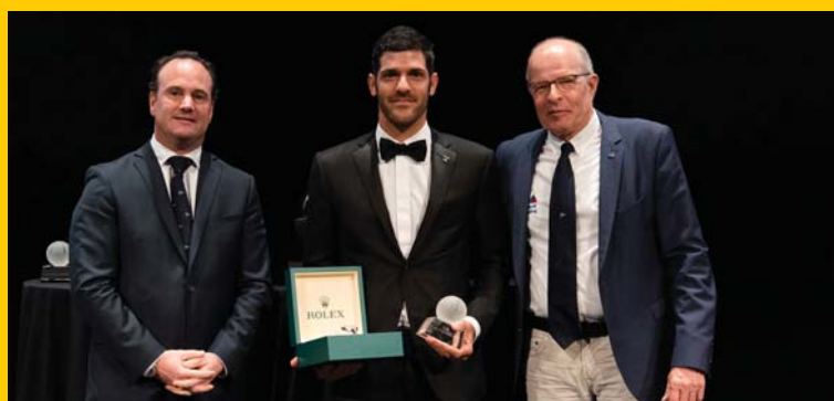
«Rolex World Sailor of the Year» για το 2018 ο Παύλος Κοντίδης!

Κορυφαίος ιστιοπλόος στον κόσμο ο Κοντίδης