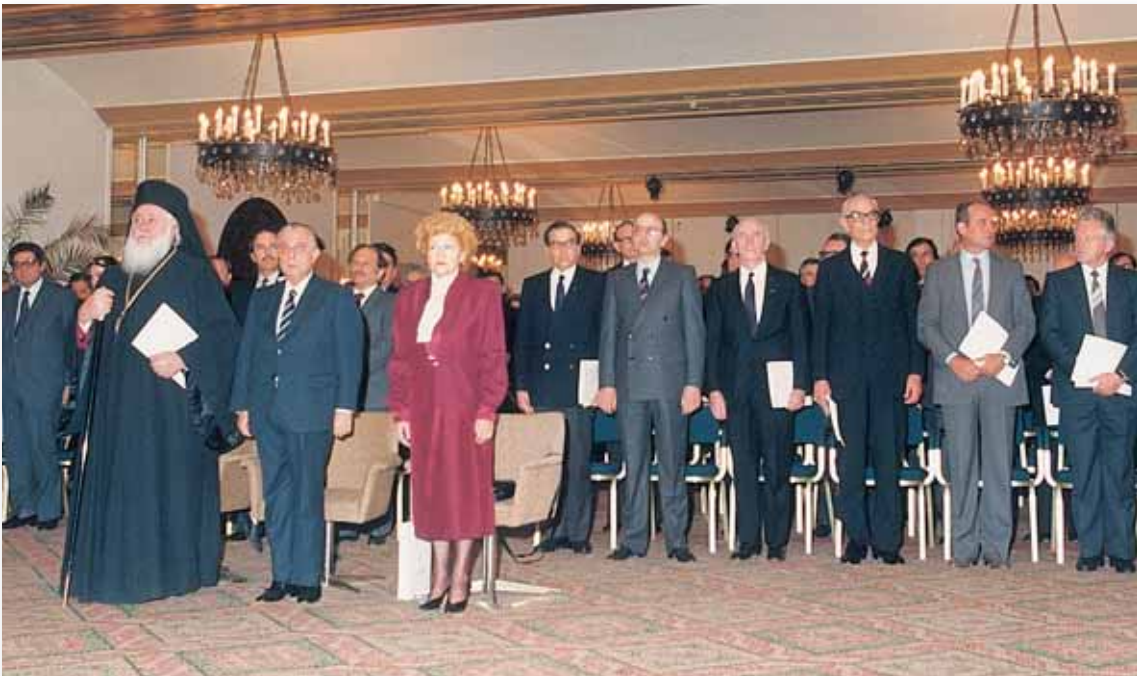
Η εγκαθίδρυση και η αποστολή της ΕΟΑΚ