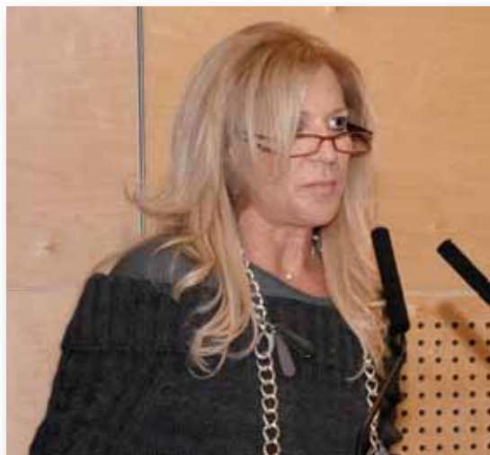
Η Κάλλη Χ΄ Ιωσήφ εκπρόσωπος του Υπουργού Παιδείας, στο βήμα της 21ης Συνόδου.

Προς αυτή την κατεύθυνση, καταλυτικό ρόλο διαδραματίζει, η πολύ καλά οργανωμένη και συστηματική προσπάθεια που συντελείται μέσα στα σχολεία μας από το Υπουργείο, και η οποία ενισχύεται με διά-