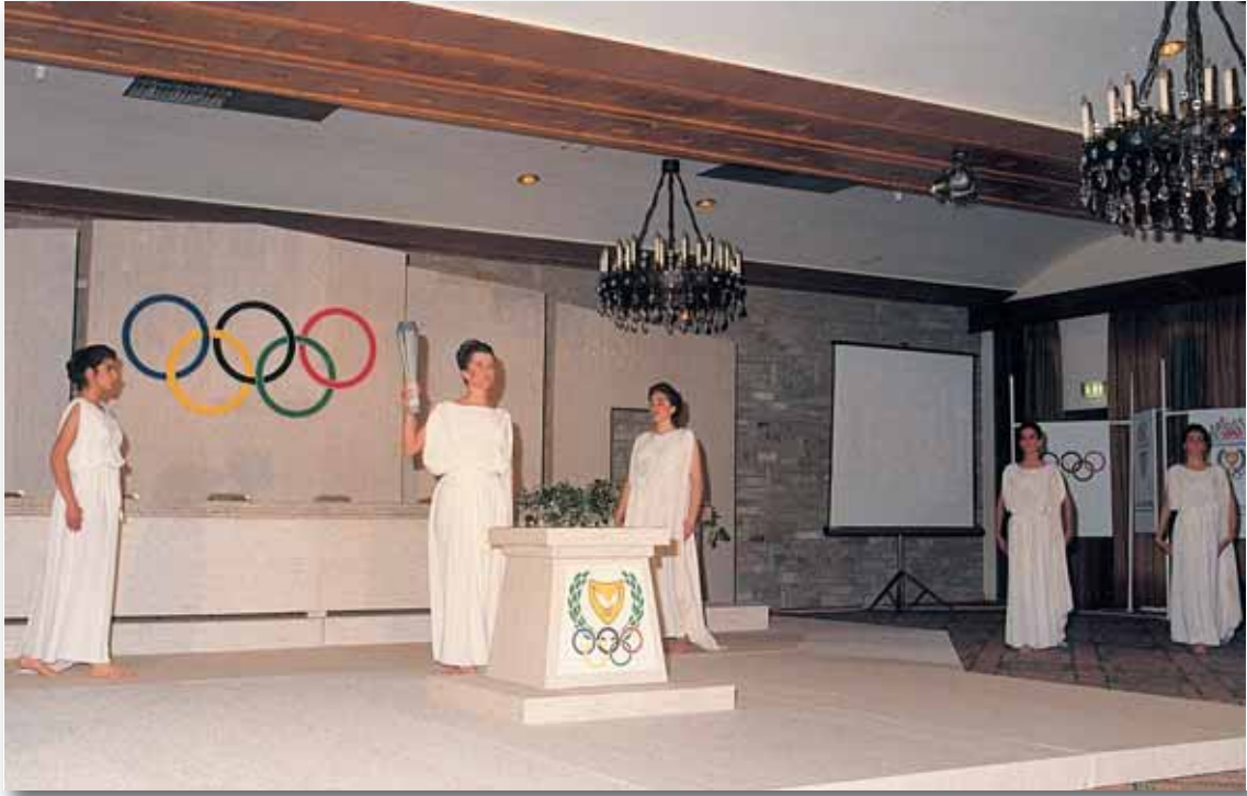
Από το τελετουργικό μέρος της εγκαθίδρυσης της Εθνικής Ολυμπιακής Ακαδημίας Κύπρου στο Ξενοδοχείο Χίλτον στις 30 Μαρτίου 1987.