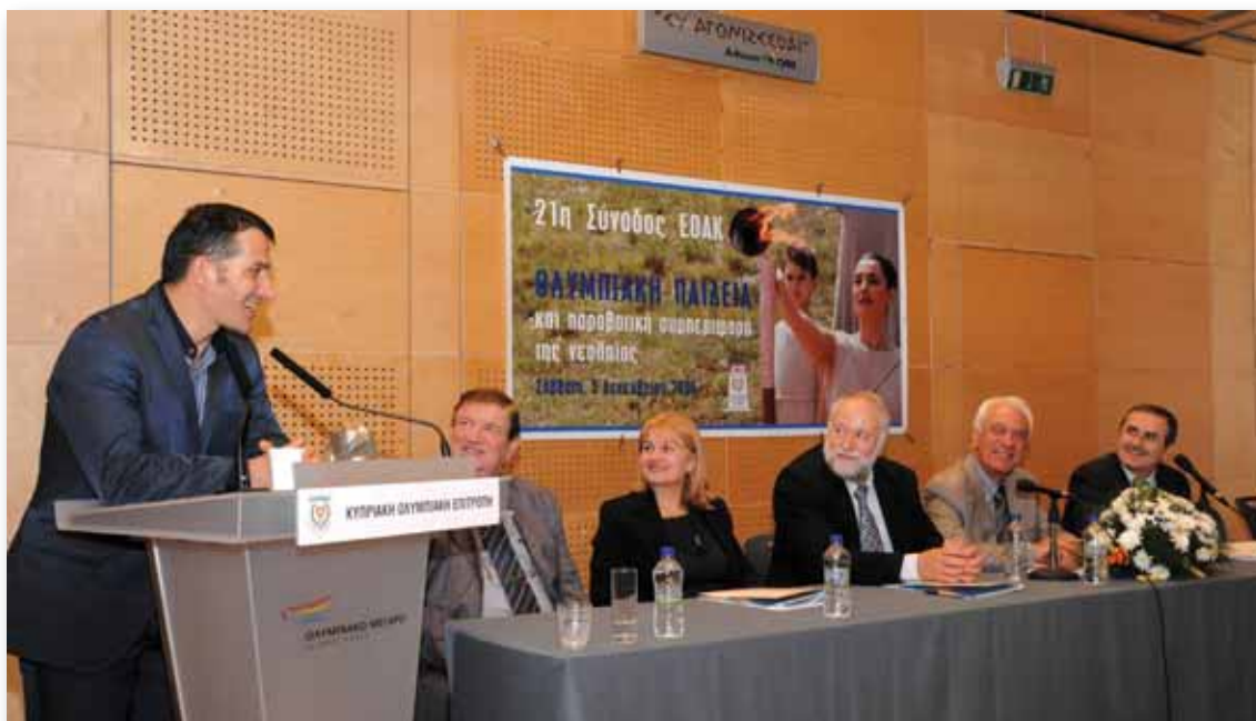
Με το χαμόγελο ως μόνιμο συνοδό... ο Πύρρος Δήμας απάντησε στις ερωτήσεις του ακροατηρίου.

κανόνα οι Ολυμπιονίκες μας. Είναι στοιχεία που καλλιεργούνται και αναπτύσσονται μέσα από την συνεχή ευγενική άμιλλα.