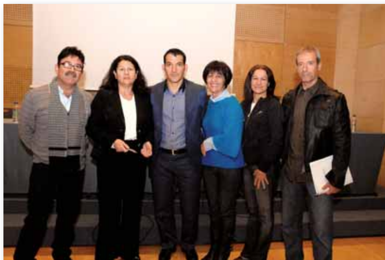
Οι κύριοι ομιλητές της 21ης Συνόδου μαζί με συνέδρους.