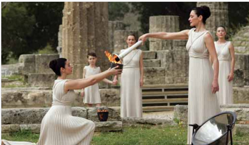
Η τελετή της αφής της Ολυμπιακής Φλόγας στην Αρχαία Ολυμπία.

Αύτες οι δύο βδομάδες που έζησα στην Αρχαία Ολυμπία ήταν μοναδικές και θα μου μείνουν αξέχαστες. Τελειώνοντας θα ήθελα και πάλι να ευχαριστήσω την Κυπριακή Ολυμπιακή Επιτροπή για την ευκαιρία που μου έδωσε να εκπροσωπήσω τη μικρή μας πατρίδα σε αυτό το πανηγυρικό συναπάντημα λαών όπου καλλιεργούνται ολυμπιακές αρχές και αξίες. «Σας ευχαριστώ πολύ».