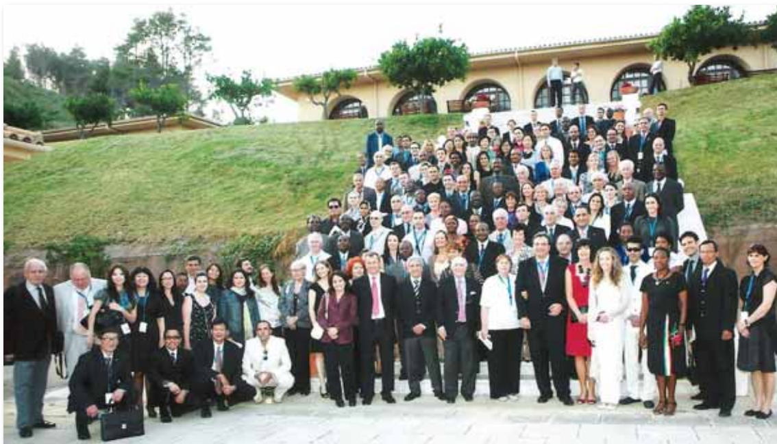
Αναμνηστική φωτογραφία όλων των συνέδρων.

και των πρωτεργατών ίδρυσης της Διεθνούς Ολυμπιακής Ακαδημίας, Carl Diem και Ιωάννη Κετσέα.