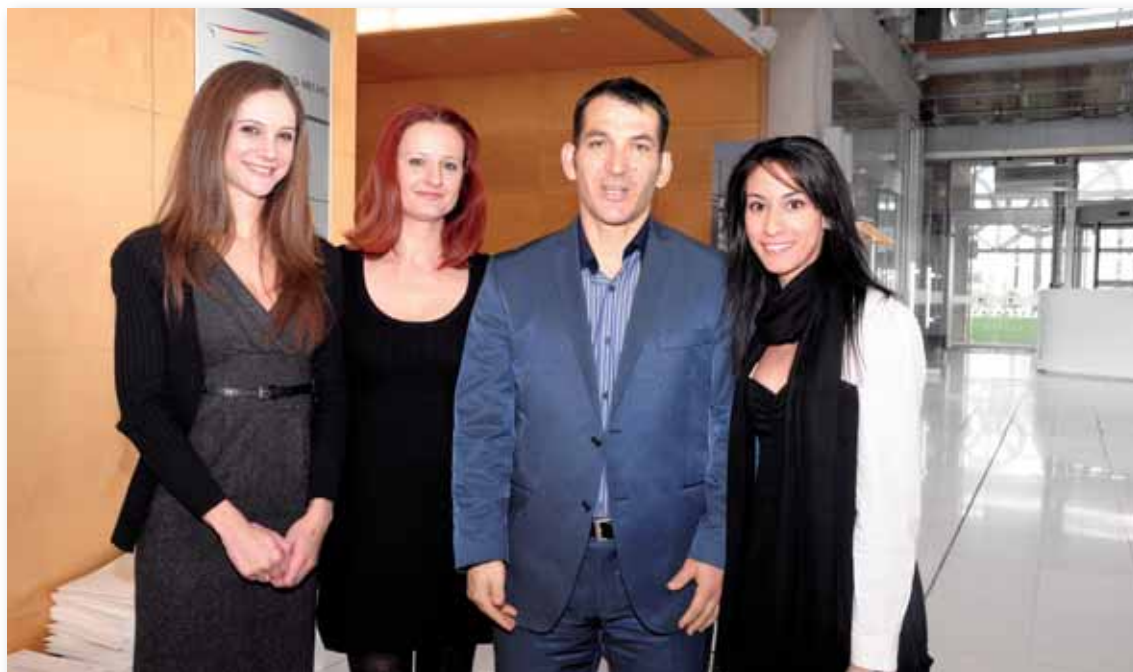
Ο Πύρρος Δήμας σε αναμνηστική φωτογραφία με προσωπικό της ΚΟΕ.