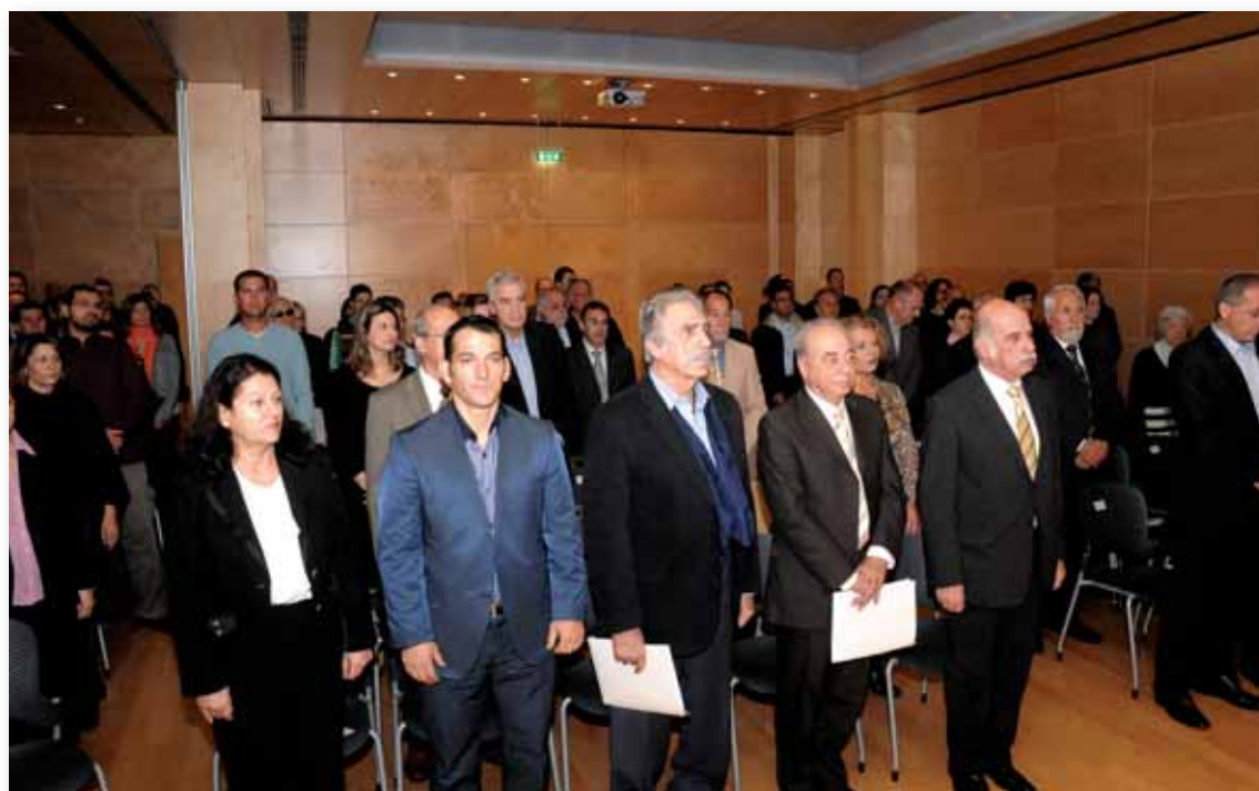
Με τον Ολυμπιακό Ύμνο, ολοκληρώθηκε το τελετουργικό της 21ης Συνόδου.