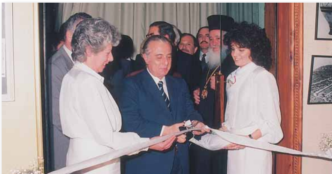
Μαζί με την εγκαθίδρυση της ΕΟΑΚ, είχαμε και τα εγκαίνια του Ολυμπιακού Μουσείου από τον αείμνηστο Σπύρο Κυπριανού.

Η Κυπριακή Ολυμπιακή Επιτροπή συναισθανόμενη πλήρως τις υποχρεώσεις και ευθύνες της απέναντι στην αθλούμενη νεολαία και τη δημιουργία σωστών ανθρώπων μέσα στον αθλητισμό δε θα φεισθεί κόπων και εξόδων για την επιτυχία του σκοπού αυτού».