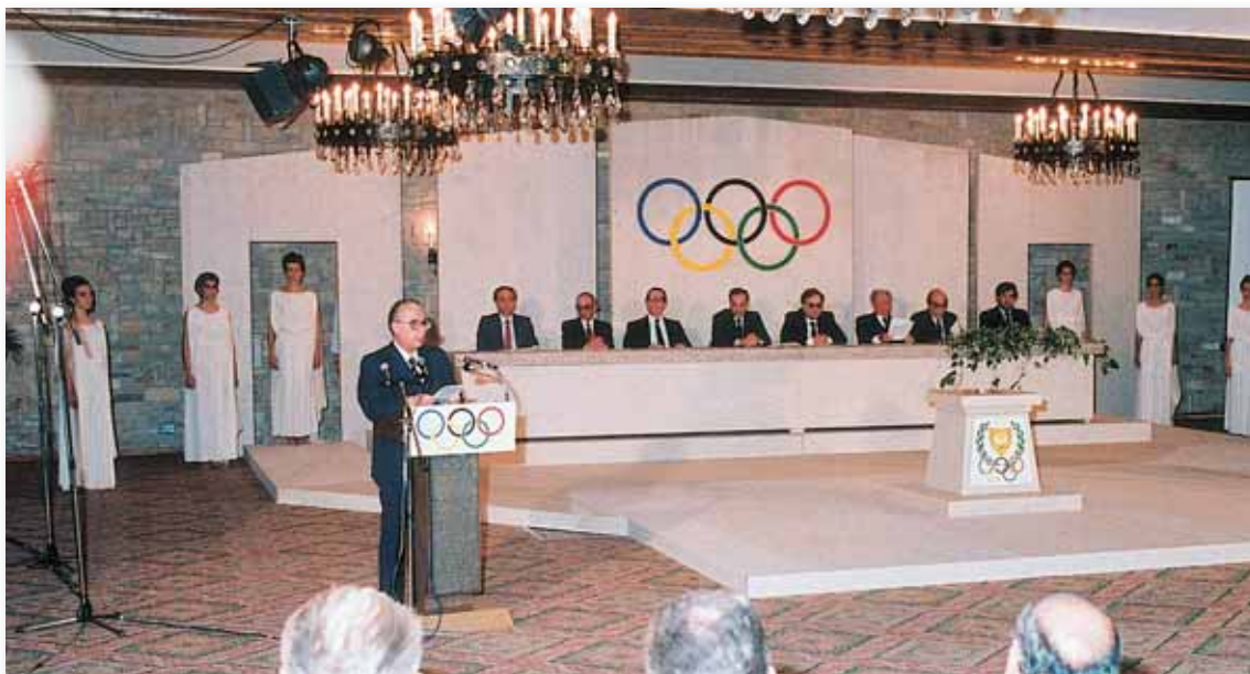
Ο αείμνηστος Πρόεδρος της Κυπριακής Δημοκρατίας Σπύρος Κυπριανού με ομιλία του εγκαθίδρυσε την ΕΟΑΚ

από την αναβίωσή τους. Και θέλω να διαβεβαιώσω ότι προς το σκοπό αυτό η Κύπρος θα καταβάλει κάθε δυνατή προσπάθεια.