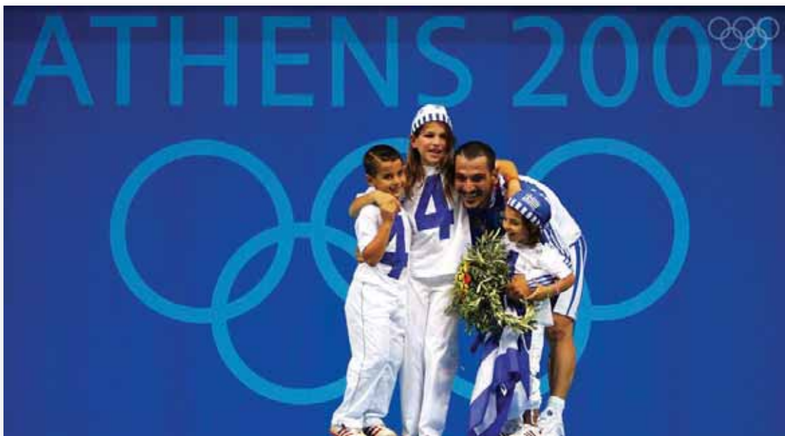
Ο Πύρρος Δήμας τη στιγμή που αποχωρεί από την ενεργό δράση, μαζί με τα παιδιά του. Η Ελένη, ο Βίκτωρας και η μικρή Μαρία.