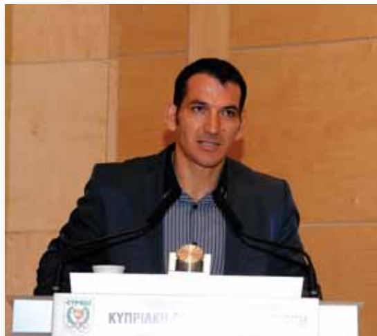
Ο Πύρρος Δήμας, στο βήμα της 21ης Συνόδου.

Ήταν απλός και μίλησε με τη βιωματική γλώσσα ενώ θα λέγαμε πως ήταν παράλληλα και σεμνός, στοιχείο έντονο στον χαρακτήρα του, ενώ ήταν και έμφυτο το πηγαίο χιούμορ του. Ο λόγος για τον μεγαλύτερο Έλληνα αθλητή όλων των εποχών, τον Πύρρο Δήμα, το φτωχόπαιδο της Χειμάρρας, το Ελληνόπουλο της Ηπείρου που χάρισε στην Ελλάδα χρυσά μετάλλια σε Ολυμπιακούς και τη σίκωσε ψηλά στον Παγκόσμιο Αθλητικό Χάρτη.