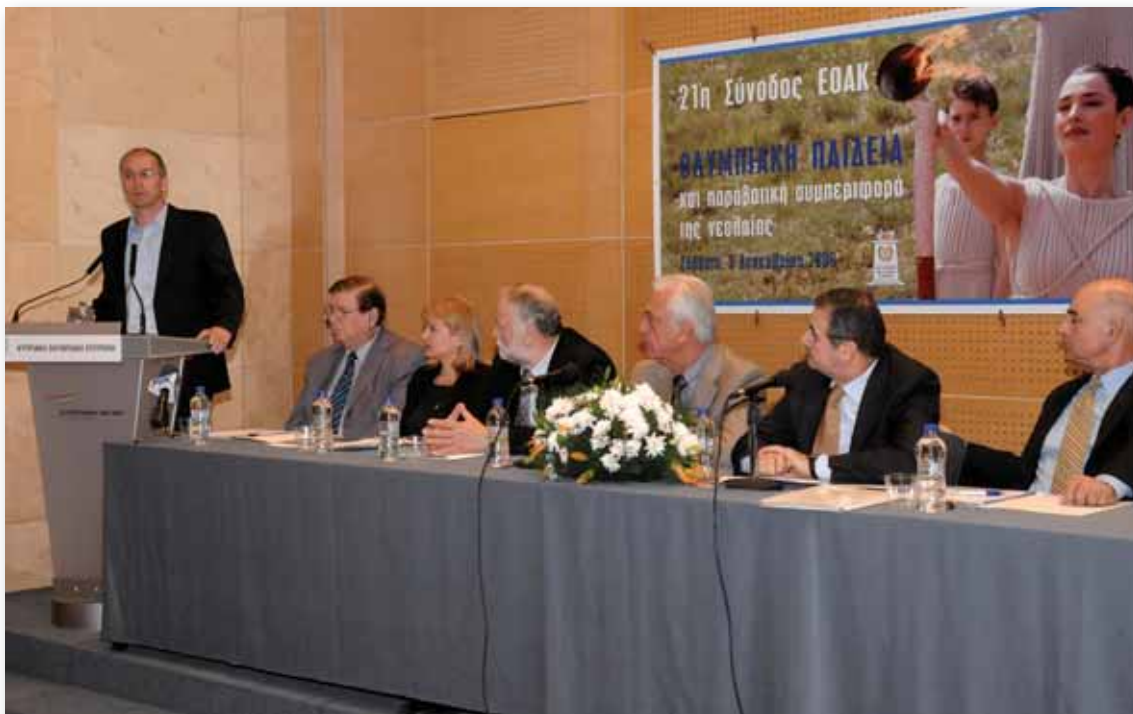
Ο Πρόεδρος του ΚΟΑ Δρ Νίκος Καρτακούλλης στο βήμα της 21ης Συνόδου. Είναι ιδιαίτερα ευαίσθητος με τα Ολυμπιακά θέματα και γενικά την Ολυμπιακή Παιδεία. Στήριξε και εξακολουθεί να στηρίζει το έργο της Εθνικής Ολυμπιακής Ακαδημίας Κύπρου.

Η Εφορεία της Εθνικής Ολυμπιακής Ακαδημίας Κύπρου στην προσπάθειά της να δραστηριοποιήσει και άλλους παράγοντες στο έργο της, προχώρησε στη σύσταση Επαρχιακών Επιτροπών σ' όλες τις πόλεις. Ήδη η Επαρχιακή Επιτροπή της Πάφου προχώρησε στην διοργάνωση δυο πολύ καλά προγραμματισμένων εκδηλώσεων.