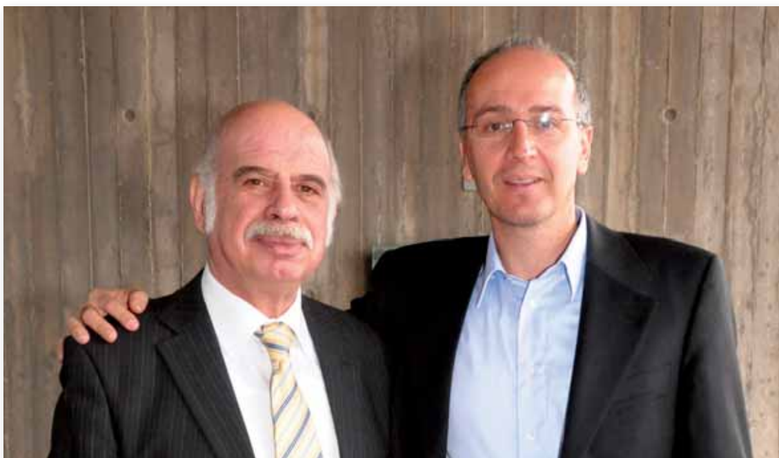
Ο πρόεδρος της ΚΟΕ Ουράνιος Ιωαννίδης και ο Πρόεδρος του ΚΟΑ Δρ. Νίκος Καρτακούλλης σε διάλειμμα της 21ης Συνόδου.