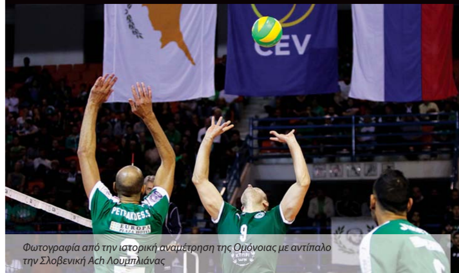
Φωτογραφία από την ιστορική αναμέτρηση της Ομόνοιας με αντίπαλο την Σλοβενική Ach Λουμπλιάνας

Στο πλαίσιο των Ευρωπαϊκών διοργανώσεων ο Παφιακός συμμετέχει στο Challenge Cup Ανδρών και αντιμετωπίζει την Γαλατασαράι (νικήτρια βαλκανικού κυπέλλου 2016) σε δύο αγώνες που θα διεξαχθούν στην Κωνσταντινούπολη στις 6 και 8 Δεκεμβρίου. Η ΑΕΛ θα αγωνιστεί στο CEV Challenge Cup Γυναικών μεταξύ 14-16 Δεκεμβρίου με αντίπαλο την Μπρατισλάβα στην Λεμεσό, ενώ ο επαναληπτικός θα διεξαχθεί τον Ιανουάριο στην Σλοβακία.