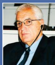
Ντίνος Μιχαηλίδης Πρόεδρος ΚΟΕ

Είμαι βέβαιος ότι αυτή η προσπάθεια θα εκτιμηθεί και θα ενισχυθεί από ιδέες προς το καλύτερο.