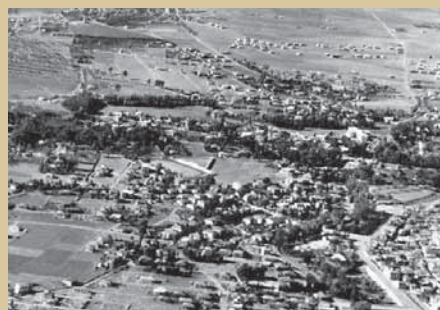
Η αεροφωτογραφία της Λευκωσίας από τη δεκαετία του '40, δείχνει πως η περιοχή εκτός των τειχών ήταν ακόμη αραιοκατοικημένη.