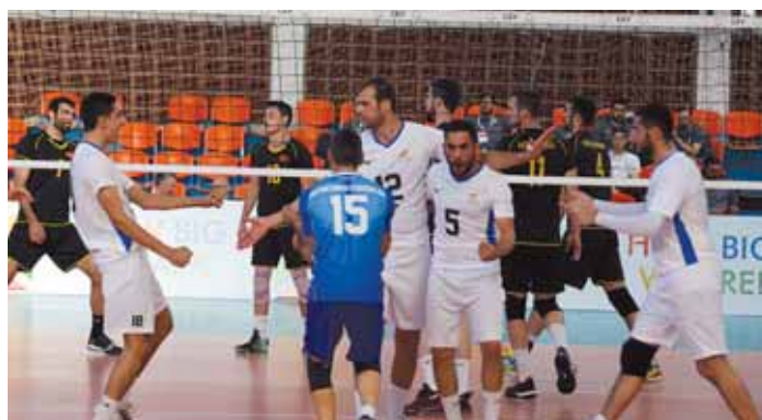
Η Εθνική ανδρών πετόσφαιρας πανηγυρίζει έναν πόντο στο ματς με το Μαυροβούνιο. Οι δύο εθνικές, ανδρών και γυναικών, είχαν πολύ καλή παρουσία και πήραν τελικά αργυρά μετάλλια.