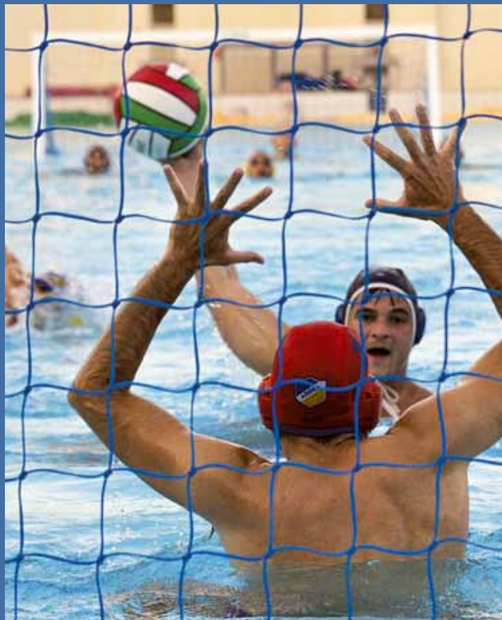
Στιγμιότυπο από φετινό αγώνα του ΑΠΟΕΛ στην υδατοσφαίριση

Έπεσε τον Μάιο η αυλαία στο Παγκύπριο πρωτάθλημα υδατοσφαίρισης με τη διεξαγωγή της 14 ης και τελευταίας αγωνιστικής. Πρωταθλητής και κυπελλούχος είχε αναδειχθεί εδώ και μέρες ο ΑΠΟΕΛ, ο οποίος έκανε το νταμπλ. Στο τελευταίο παιχνίδι της χρονιάς, ο πρωταθλητής ΑΠΟΕΛ επικράτησε του Ναυτικού Ομίλου Αμμοχώστου με 17-10. Οι γαλαζοκίτρινοι πήραν τον τίτλο με 12 νίκες σε ισάριθμους αγώνες. Ακολούθησε με 10 νίκες σε 12 ματς ο Ναυτικός Όμιλος Πάφου, ενώ τρίτος ήταν ο Ν.Ο. Μέσα Γειτονιάς με 7 νίκες και 1 ισοπαλία σε 12 ματς.