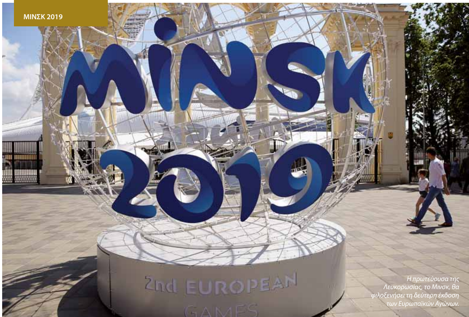
Η πρωτεύουσα της Λευκορωσίας, το Μινσκ, θα φιλοξενήσει τη δεύτερη έκδοση των Ευρωπαϊκών Αγώνων.