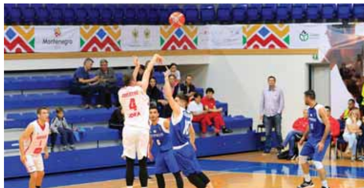
Εκτός βάρους έμειναν οι Εθνικές μπάσκετ ανδρών και γυναικών, σε μια παρουσία που δεν ικανοποίησε κανένα.