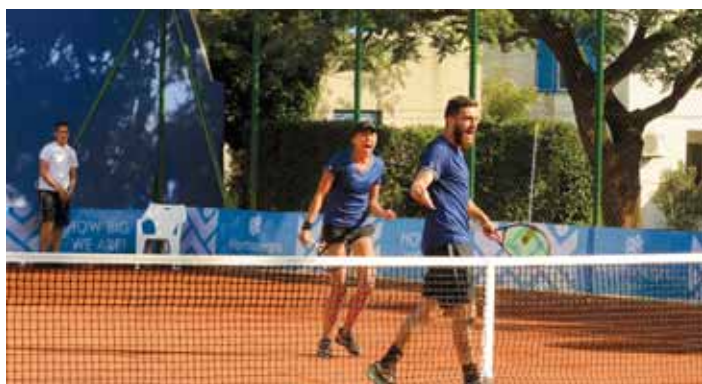
Η Ραλούκα Σερμπιάν και ο Λευτέρης Νέος πανηγυρίζουν την πρόκριση στον τελικό του μικτού διπλού, εκεί όπου τελικά πήραν και το χρυσό μετάλλιο.