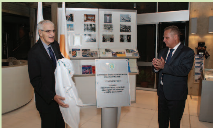
Τα αποκαλυπτήρια της πλάκας των εγκαινίων από τον Υπουργό Παιδείας, Πολιτισμού, Αθλητισμού και Νεολαίας.

όλη τη διαδικασία λειτουργίας της Βιβλιοθήκης, είτε: «Ο χώρος μιας βιβλιοθήκης είναι ιερός, γιατί εδώ φυλάσσονται κειμήλια της συλλογικής μνήμης και παρακαταθήκες σοφών ανθρώπων. Φυλάσσονται τεκμήρια της Ιστορίας ενός λαού, ό,τι τον κρατά ριζωμένο στη γη του».