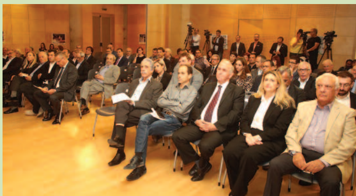
Μεγάλη η προσέλευση στα εγκαίνια της Κυπριακής Ολυμπιακής Βιβλιοθήκης.