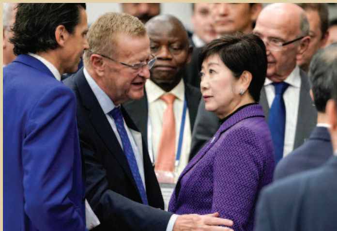
Η Γιουρίκο Κοϊκε, μαζί με στελέχη της ΔΟΕ στην πρόσφατη τετραμερή συνάντηση

Αρκετές αρνητικές αντιδράσεις από τους διοργανωτές αλλά και τους αθλητές προκάλεσε η απόφαση της Διεθνούς Ολυμπιακής Επιτροπής να μεταφέρει τους Μαραθώνιους Ανδρών και Γυναικών, τα 20 χλμ Βάδην ανδρών και γυναικών και τα 50 χλμ Βάδην ανδρών από το Τόκιο, στην πόλη Σάπορο, που βρίσκεται περίπου 800 χιλιόμετρα βόρεια της πρωτεύουσας, στη νησί Χοκαϊντό. Ο λόγος σύμφωνα με τη ΔΟΕ, η έντονη ζέση που αναμένεται τις ημέρες των Αγώνων. Σε τετραμερή συνάντηση που έγινε την 1η Νοεμβρίου 2019 στο Τόκιο, μεταξύ ΔΟΕ, οργανωτικής επιτροπής, κυβέρνησης του Τόκιο και κυβέρνησης της Ιαπωνίας, συμφωνήθηκε όπως δεν θα υπάρξουν άλλες αλλαγές στο πρόγραμμα, ότι η ΔΟΕ είναι η μοναδική αρμόδια για αλλαγές και πως το κόστος για το Σάπορο δεν θα είναι ευθύνη των διοργανωτών. Η κυβερνήτης του Τόκιο, Γιουρίκο Κοϊκε, τόνισε ότι διαφωνεί με την απόφαση, αλλά η τελική απόφαση ανήκει στη ΔΟΕ. Με την αθλήτρια Νταγκμάρα Χάντζλικ να διεκδικεί πρόκριση για το «Τόκιο 2020», είναι ορατό το ενδεχόμενο η Κύπρος να συμμετάσχει στον Μαραθώνιο γυναικών στο Σάπορο.