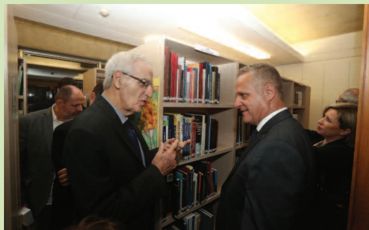
Ο Υπουργός Παιδείας, Πολιτισμού, Αθλητισμού και Νεολαίας Δρ Κώστας Χαμπασιούρης, συνοδευόμενος από τον πρόεδρο της ΚΟΕ κ. Ντίνο Μιχαηλίδη, επισκέφτηκε την Ολυμπιακή Βιβλιοθήκη.