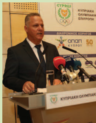
Ο Υπουργός Δρ. Χαμπαούρης.