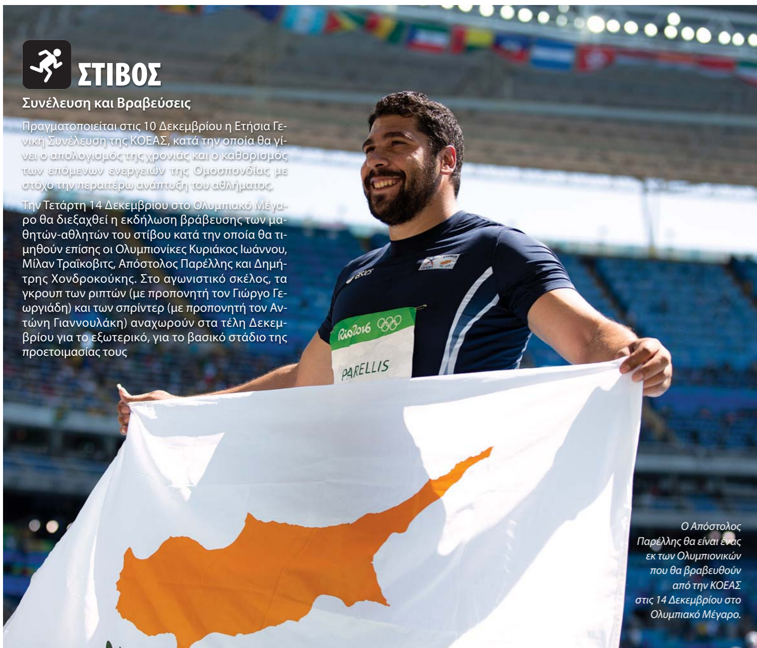
Ο Απόστολος Παρέλλης θα είναι ένας εκ των Ολυμπιονικών που θα βραβευθούν από την ΚΟΕΑΣ στις 14 Δεκεμβρίου στο Ολυμπιακό Μέγαρο.

Την Τετάρτη 14 Δεκεμβρίου στο Ολυμπιακό Μέγαρο θα διεξαχθεί η εκδήλωση βράβευσης των μαθητών-αθλητών του στίβου κατά την οποία θα τιμηθούν επίσης οι Ολυμπιονίκες Κυριάκος Ιωάννου, Μίλαν Τραϊκόβιτς, Απόστολος Παρέλλης και Δημήτρης Χονδροκούκης. Στο αγωνιστικό σκέλος, τα γκρουπ των ριπτών (με προπονητή τον Γιώργο Γεωργιάδη) και των σπρίντερ (με προπονητή τον Αντώνη Γιαννουλάκη) αναχωρούν στα τέλη Δεκεμβρίου για το εξωτερικό, για το βασικό στάδιο της προετοιμασίας τους.