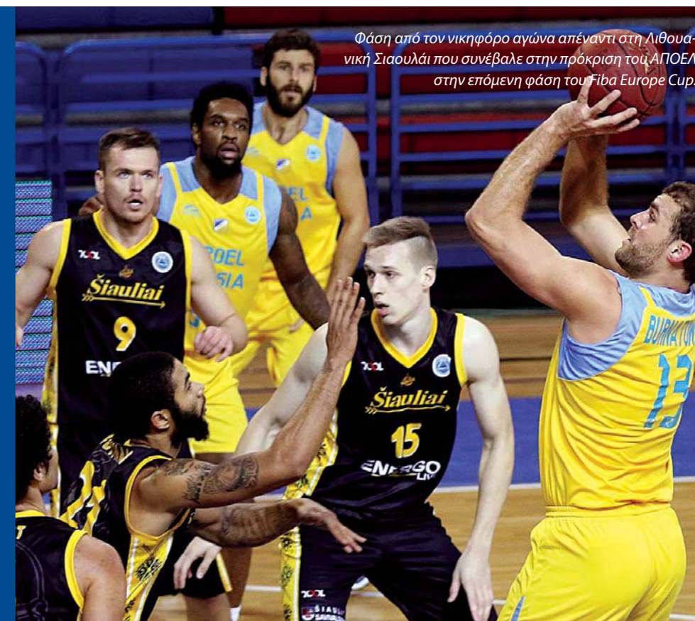
Φάση από τον νικηφόρο αγώνα απέναντι στη Λιθουανική Σιαουλάι που συνέβαλε στην πρόκριση του ΑΠΟΕΛ στην επόμενη φάση του FIBA Europe Cup.

Στην επόμενη φάση ο ΑΠΟΕΛ θα αγωνιστεί στον 13° όμιλο και θα αντιμετωπίσει τις Τέλεκομ (Γερμανία), Πριενάι (Λιθουανία) και Όμπερβαρτ (Αυστρία). Στο πρώτο της παιχνίδι η ομάδα της Λευκωσίας θα ταξιδέψει στη Βόννη της Γερμανίας στις 14 Δεκεμβρίου, και η αυλαία θα πέσει στις 25 Ιανουαρίου με την εντός έδρας αναμέτρηση του ΑΠΟΕΛ με αντίπαλο την ομάδα από την Αυστρία.