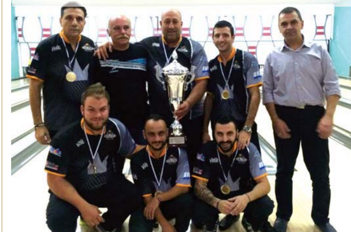
Η ομάδα των Navigators με το βαρύτιμο Κύπελλο του Σούπερ Καπ

Πραγματοποιήθηκε την Τρίτη 22 Νοεμβρίου στο Rock N' Bowl Bowlers Club στη Λάρνακα, το Σούπερ Καπ «Ρογήρος Χριστοφίδης». Πρόκειται για τον αγώνα που φέρνει αντιπάλους την Πρωταθλήτρια των πρωταθλητριών των έξι ομίλων Μπούουλιγκ με την Κυπελλούχο των Κυπελλούχων των έξι ομίλων (ένας ανά Επαρχία). Για την αγωνιστική περίοδο στον τελικό βρέθηκαν αντιμέτωποι οι πρωταθλητές Navigators με το Κυπελλούχο ΑΠΟΕΛ. Νικήτρια αναδείχτηκε η ομάδα των Navigators που επικράτησε στο σύνολο των κορύνων με 2842 έναντι 2737 του ΑΠΟΕΛ. Ο θεσμός του Super Cup είναι αφιερωμένος στην μνήμη του αιμίνηστου Ρογήρου Χριστοφίδη, πρωτοεργάτη του αθλητικού μπόουλιγκ στην Κύπρο. Με τον αγώνα αυτό ολοκληρώθηκε η αγωνιστική περίοδος 2015-16, ενώ ήδη έχουν ξεκινήσει όλα τα πρωταθλήματα για την νέα αγωνιστική περίοδο 2016-17.