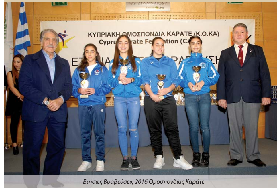
Ετήσιες Βραβεύσεις 2016 Ομοσπονδίας Καράτε