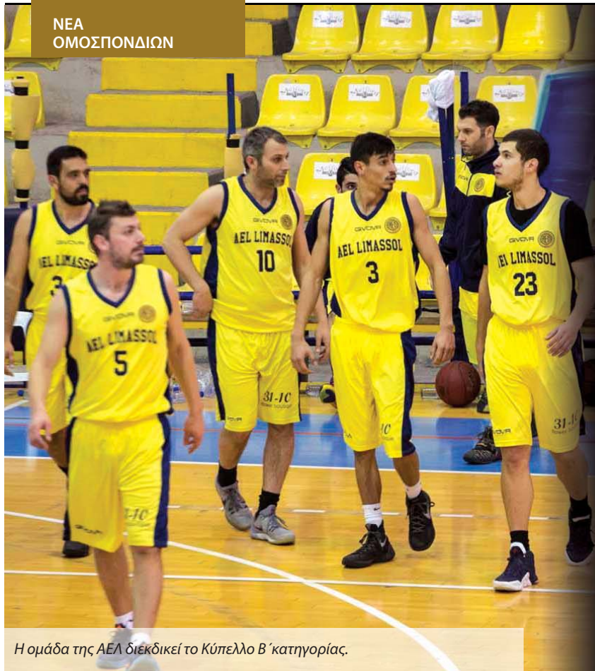
Η ομάδα της ΑΕΛ διεκδικεί το Κύπελλο Β' κατηγορίας.