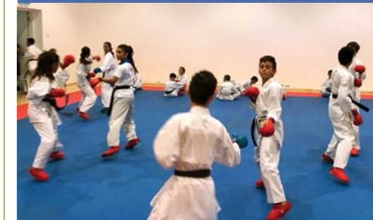
Οι ομάδες του Μαυρομάτη Αγίου Παύλου και της Goodgate ΕΘΑ.

Σε μια άλλη δραστηριότητα, φιλοξενείται από 31 Αυγούστου μέχρι 3 Σεπτεμβρίου στην Κακοπετριά το ετήσιο κάμπινγκ της Ομοσπονδίας, με τη συμμετοχή περίπου 250 αθλητών, προπονητών και διαιτητών. Το πρόγραμμα περιλαμβάνει προπονήσεις στις οποίες θα συμμετέχουν επίσης εικοσι αθλητές από το Ισραήλ και την Αυστρία, καθώς και σεμινάρια.