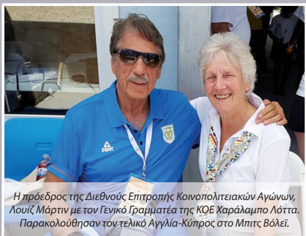
Η πρόεδρος της Διεθνούς Επιτροπής Κοινοπολιτειακών Αγώνων, Λουίζ Μάρτιν με τον Γενικό Γραμματέα της ΚΟΕ Χαράλαμπο Λόττα. Παρακολούθησαν τον τελικό Αγγλία-Κύπρος στο Μπιτς Βόλεϊ.