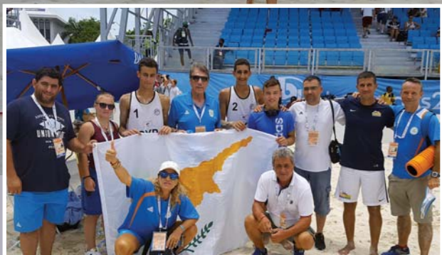
Πολλά μέλη της αποστολής βρέθηκαν κοντά στις προσπάθειες της ομάδας και πανηγύρισαν την κατάκτηση του αργυρού μεταλλίου.