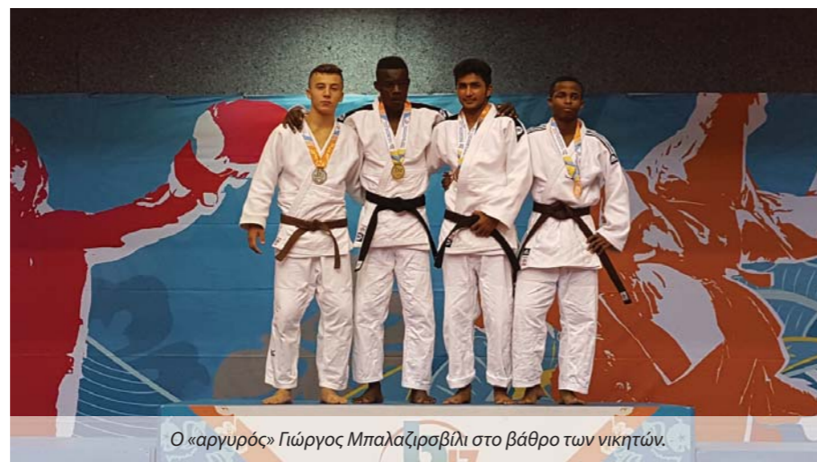
Ο «αργυρός» Γιώργος Μπαλαρζισβίλι στο βάθρο των νικητών.