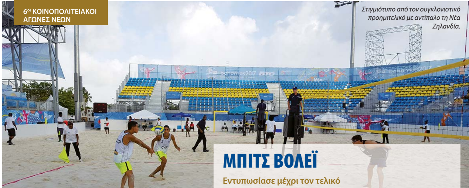
Στιγμιότυπο από τον συγκλονιστικό προημιτελικό με αντίπαλο τη Νέα Ζηλανδία.