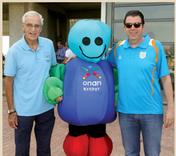
Ο Πρόεδρος της ΚΟΕ Ντίνος Μιχαηλίδης με τον Δήμαρχο Στροβόλου Ανδρέα Παπαχαλαράμπος και τον ΟΠΑΠάκη την μασκότ της ΟΠΑΠ Κύπρου, χορηγού των εκδηλώσεων.

Στις εκδηλώσεις «Ολυμπιακή Ημέρα 2017» συμμετείχαν δεκαεννέα αθλητικές ομοσπονδίες, οι οποίες δημιούργησαν χώρους επίδειξης και έδωσαν την ευκαιρία στους επισκέπτες να δοκιμάσουν τα διάφορα αθλήματα. Οι ομοσπονδίες που έδωσαν το παρών τους ήταν: Αντισφαίριση, Γυμναστική, Επιτραπέζια Αντισφαίριση, Καλαθοσφαίρα, Καράτε, Μπάντμιντον, Πάλη, Πεντάθλου-Διάθλου, Πετόσφαιρα, Ταεκβοντό, Τζούντο, Τοξοβολία, Χειροσφαίριση, Κλασικού Αυτοκινήτου, Μπούουλινγκ, Μπριτζ, Σαίττας, Σάμπο και Σκακιού.