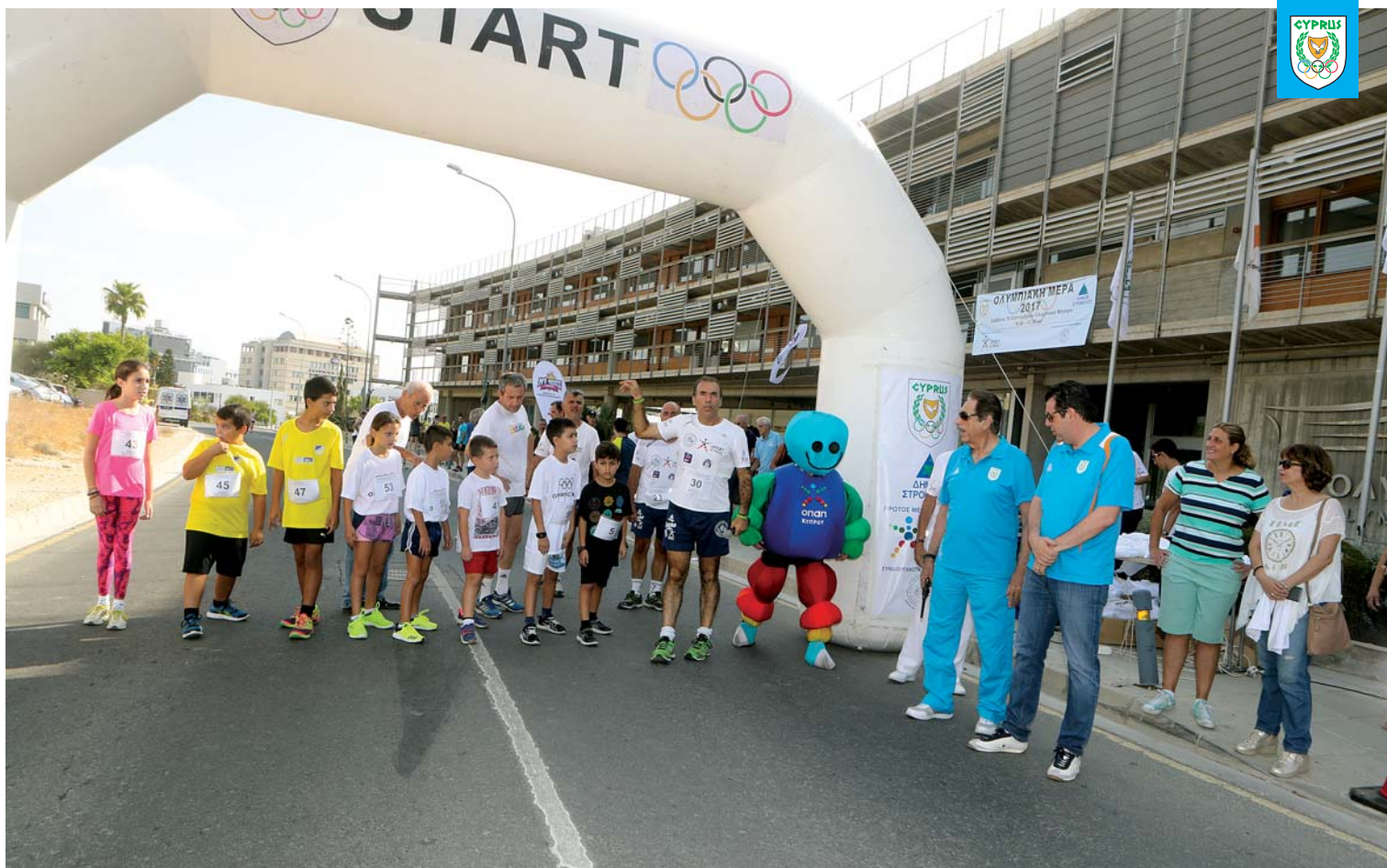
Εκκίνηση αγώνα Δρόμου για παιδιά