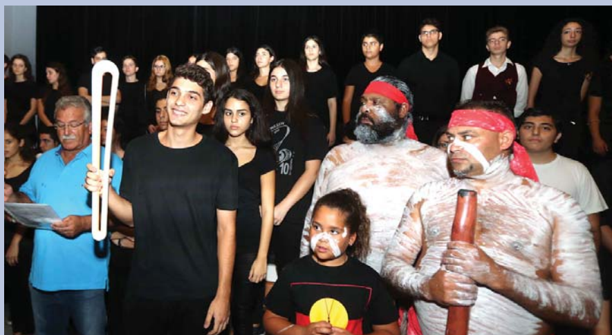
Το γκρουπ «Koomurri» κατά την επίσκεψη στο Λανίτειο Λύκειο στη Λεμεσό την Τρίτη 26 Σεπτεμβρίου.