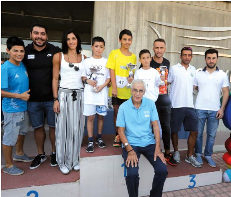
Ο Πρόεδρος της ΚΟΕ Ντίνος Μιχαηλίδης στις απονομές του αγώνα Δρόμου για παιδιά με τους αθλητές της Ολυμπιακής Ομάδας.