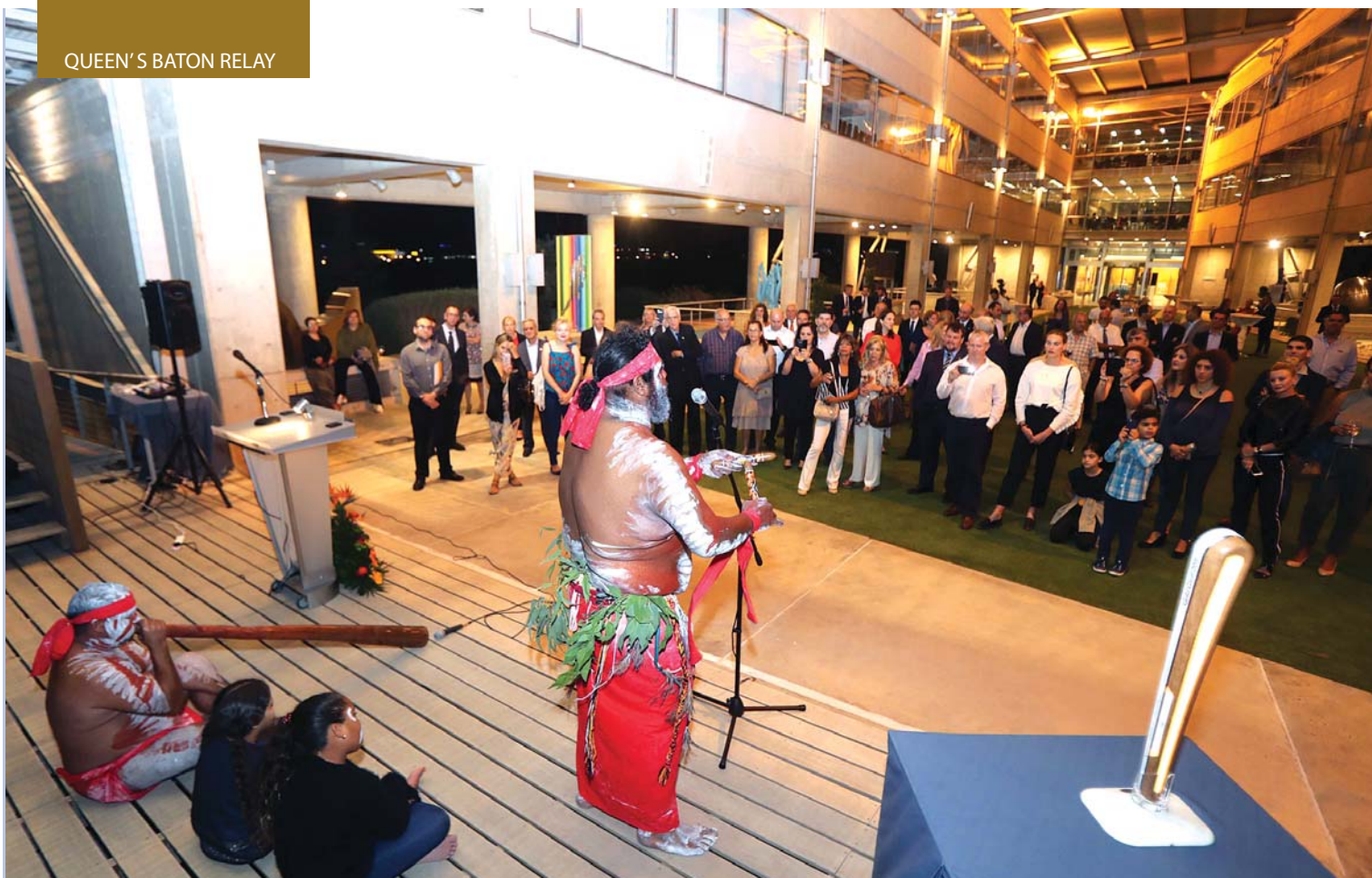
Οι «Kooomirri» παρουσίασαν καλλιτεχνικό πρόγραμμα των αυτόχθονων τη Αυστραλίας στο περιθώριο της δεξίωσης στο Ολυμπιακό Μέγαρο.