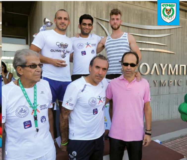
Ο Αντιπρόεδρος της ΚΟΕ Γιώργος Χρυσοστόμου στις απονομές των νικητών της κατηγορίας Ανδρών 19-29 ετών.