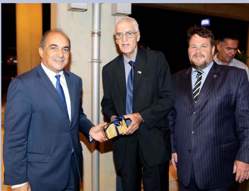
Ο Πρόεδρος της Βουλής Δημήτρης Συλλούρης, ο πρόεδρος της ΚΕΚΑ Ντίνος Μιχαηλίδης και ο Υπάτος Αρμοστής της Αυστραλίας Άλαν Σουίτμαν στη δεξίωση στο Ολυμπιακό Μέγαρο.

Στο χαιρετισμό του ο πρόεδρος της ΚΕΚΑ κ. Ντίνος Μιχαηλίδης αναφέρθηκε στη σημαντικότητα των Κοινοπολιτειακών Αγώνων για την Κύπρο, είπε ότι αποτελεί επιπλέον κίνητρο για αθλητική επιτυχία τον Απρίλιο η παρουσία μεγάλης κυπριακής παροικίας στην Αυστραλία, ενώ εξέφρασε τη σιγουριά του ότι οι Αγώνες θα διοργανωθούν με επιτυχία, λόγω της τεχνογνωσίας και των ικανοτήτων των Αυστραλών.