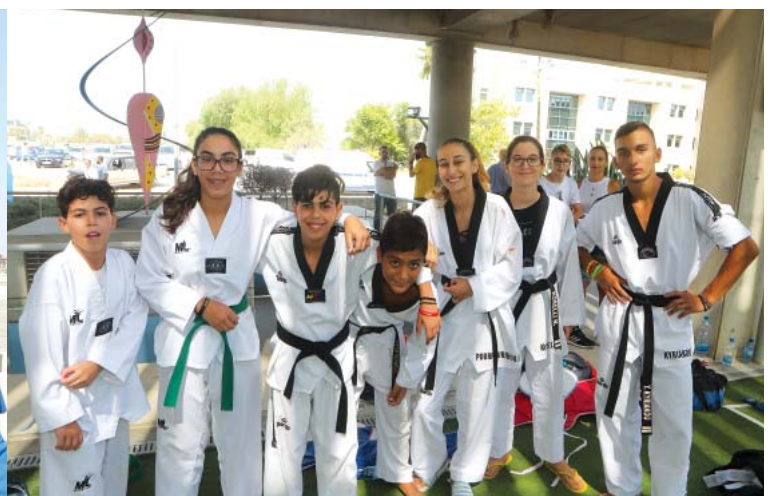
Τάε Κβο Ντο