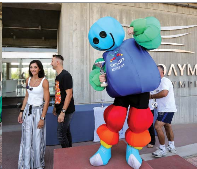
Η εκδήλωση περιλάμβανε και απονομή στην μασκότ της ΟΠΑΠ, τον ΟΠΑΠάκη.