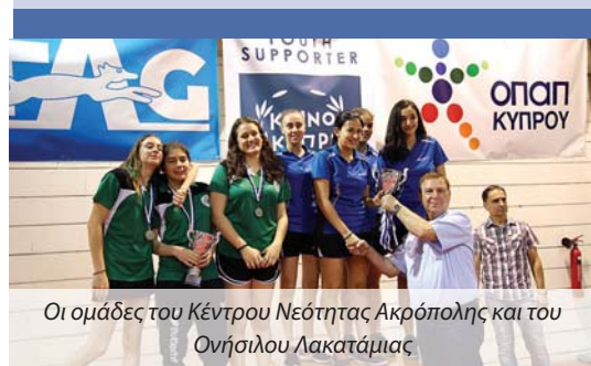
Οι ομάδες του Κέντρου Νεότητας Ακρόπολης και του Ονήσιλου Λακατάμιας