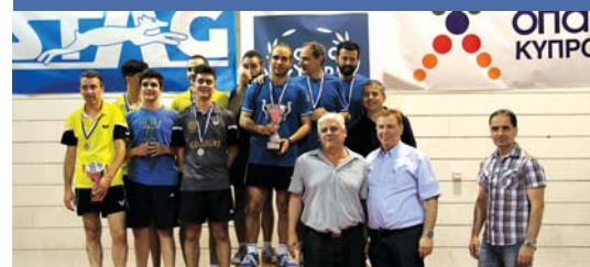
Οι ομάδες του Μαυρομάτη Αγίου Παύλου και της Goodgate ΕΘΑ.

Οι απονομές των επάθλων στις τέσσερις ομάδες έγιναν από τον Πρόεδρο της ΠΟΕΠΑ Ανδρέα Γεωργίου.