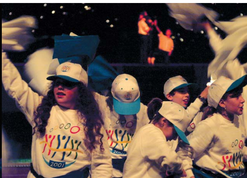
Φωτογραφίες από την τελετή έναρξης των ΑΜΚΕ το 2001, όταν το Σαν Μαρίνο διοργάνωσε τους αγώνες για δεύτερη φορά.