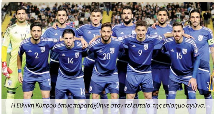
Η Εθνική Κύπρου όπως παρατάχθηκε στον τελευταίο της επίσημο αγώνα.

Το Σάββατο 3 Ιουνίου η Κύπρος θα αντιμετωπίσει σε φιλικό την πρωταθλήτρια Ευρώπης Πορτογαλία στο Εστορίλ, ενώ έξι μέρες μετά, στην πόλη Φάρο, η Εθνική θα κόντραριστεί με το Γιβραλτάρ για τα προκριματικά του Μουνιάλ. Το Γιβραλτάρ δίνει τα επίσημα εντός έδρας παιχνίδια του στην Πορτογαλία, λόγω έλλειψης κατάλληλου γηπέδου στο μικρό κράτος των μόλις 30 χιλιάδων κατοίκων.