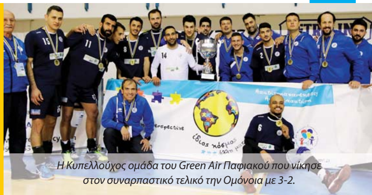
Η Κυπελλούχος ομάδα του Green Air Παφιακού που νίκησε στον συναρπαστικό τελικό την Ομόνοια με 3-2.

Στους βασικούς στόχους του Σύνδεσμος Φίλων και Συγγενών Ατό-