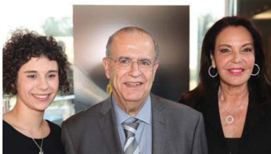
Η φωτογράφος με τον κ. Ιωάννη Κασουλίδη και την κα Κατερίνα Παναγοπούλου πρέσβυρα της Ελλάδας στο Συμβούλιο της Ευρώπης για τον Αθλητισμό, την Ανοχή και το Ευ Αγωνίζεσθαι και Πρόεδρος του Πανελληνίου Αθλητικού Σωματείου Γυναικών «Καλλιπάτειρα».