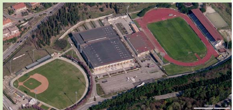
Το αθλητικό συγκρότημα του "Serravalle" όπου θα χτυπά η καρδιά των αγώνων.

Η περιοχή Φόντε ντελ Όβο, που βρίσκεται περίπου δέκα χιλιόμετρα μακριά από το Σεραβάλε, θα φιλοξενήσει την Τοξοβολία, το Τένις και την Ορεινή Ποδηλασία. Το (μακρινό για τα δεδομένα του Σαν Μαρίνο, μόλις έντεκα χιλιόμετρα μακριά από το Σεραβάλε) Φαετάνο θα υποδεχτεί τους αθλητές της Ποδηλασίας Δρόμου και Time Trial. Στην