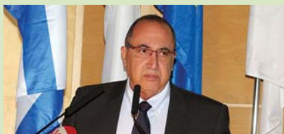
Ο επανεκλεγής πρόεδρος της ΚΙΟ, και μέλος του Εκτελεστικού Συμβουλίου της ΚΟΕ Γιάννος Φωτίου.

Όπως αναφέρεται σε ανακοίνωση που εξέδωσε η ΚΙΟ «στόχος του Διοικητικού Συμβουλίου της Ομοσπονδίας είναι να συνεχίσει να εργάζεται σκληρά για την καθημερινή βελτίωση του αθλήματος