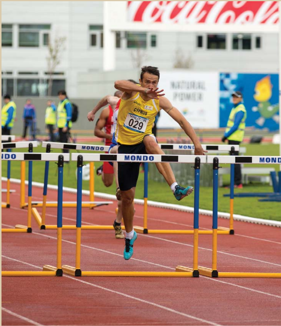
Ο 7ος Ολυμπιονίκης Μίλαν Τραϊκόβιτς από τη συμμετοχή του το 2015 όταν κατέκτησε το χρυσό μετάλλιο στα 110μ. Εμπόδια και με την ομάδα Σκυταλοδρομίας 4Χ100.

Δώδεκα αθλήματα περιλαμβάνονται στο πρόγραμμα των ΑΜΚΕ του 2017. Η Κύπρος θα λάβει μέρος στα έντεκα απ' αυτά, με μοναδική εξαίρεση το Μπούουλς, ένα σπορ όπου δεν θα υπάρχει κυπριακή συμμετοχή. Τα υπόλοιπα αθλήματα των Αγώνων είναι: Επιτραπέζια Αντισφαίριση, Καλαθόσφαιρα, Κολύμβηση, Μπιτς Βόλεϊ, Πετόσφαιρα, Ποδηλασία, Σκοποβολή, Στίβος, Τένις, Τζούντο και Τοξοβολία.