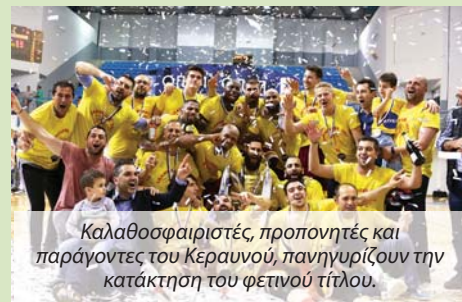
Καλαθοσφαιριστές, προπονητές και παράγοντες του Κερανού, πανηγυρίζουν την κατάκτηση του φετινού τίτλου.

Δύο πρωταθλήματα κατέκτησε ο Κεραυνός Στροβόλου τη φετινή χρονιά στην καλαθόσφαιρα. Αρχικά η γυναικεία ομάδα του Στροβολιώτικου σωματείου κέρδισε την ΑΕΛ επικρατώντας στον 5° τελικό του πρωταθλήματος που έγινε στις 23 Απριλίου, κερδίζοντας με 3-2 και διέκοψε τα έντεκα χρόνια κυριαρχίας της Λεμεσιανής ομάδας. Τις επιτυχίες συνέχισε η αντρική ομάδα, η οποία στις 5 Μαΐου έκανε το 3-1 απέναντι στην Πετρολίνα ΑΕΚ και πήρε το τρόπαιο στην Α' κατηγορία. Σε ό,τι αφορά τις διοργανώσεις κυπέλλων, η Πετρολίνα ΑΕΚ πήρε το κύπελλο Α' κατηγορίας κερδίζοντας στον τελικό τον Κεραυνό, ενώ οι Στροβολιώτες πήραν το τρόπαιο στις γυναίκες επικρατώντας της ΕΝΑΔ.