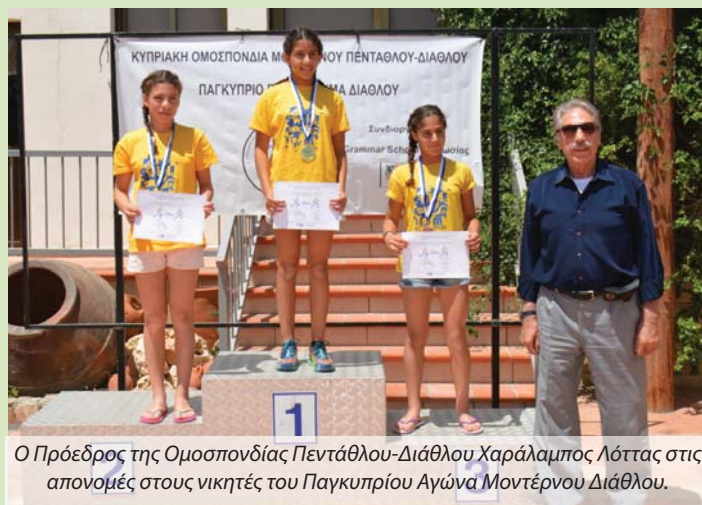
Ο Πρόεδρος της Ομοσπονδίας Πεντάθλου-Διάθλου Χαράλαμπος Λόττας στις απονομές στους νικητές του Παγκυπρίου Αγώνα Μοντέρνου Διάθλου.

Με τη συμμετοχή 56 αθλητών και αθλητριών ηλικιών 11 μέχρι 40 ετών από επτά σχολεία/σωματεία, διεξήχθη τη Δευτέρα 15 Μαΐου στο Grammar School Λευκωσίας ο πρώτος φετινός Παγκύπριος Αγώνας Μοντέρνου Διάθλου. Διοργανωτής ήταν η Κυπριακή Ομοσπονδία Πεντάθλου/Διάθλου, σε συνεργασία με το Grammar School Λευκωσίας. Η διοργάνωση αποτέλεσε αγώνα πρόκρισης για τη συμμετοχή στο Παγκόσμιο Πρωτάθλημα που θα γίνει τον Σεπτέμβριο στην Πορτογαλία. Οι αθλητές έλαβαν μέρος σε έξι ηλικιακές κατηγορίες, σε τέσσερις διαφορετικές αποστάσεις. Οι μικρότερες ηλικιακές αγωνίστηκαν διαδοχικά στο δρόμο 400μ., 100μ. κολύμβηση-δρόμο 400μ., ενώ οι επόμενες ηλικιακές κατηγορίες κάλυψαν δρόμος 800μ.-100μ. κολύμβηση-δρόμος 800μ., δρόμος 1200μ.-200μ. κολύμβηση-δρόμος 1200μ. και δρόμος 1600μ.-200μ. κολύμβηση-δρόμος 1600μ.