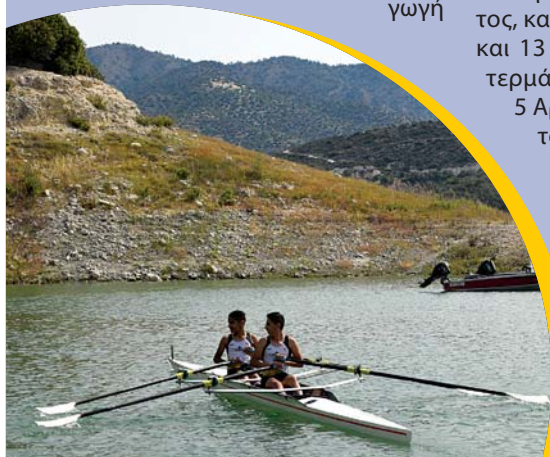
Οι Παγκύπριοι αγώνες Κωπηλασίας πραγματοποιήθηκαν στο φράγμα του Κούρρη.

Σε ανακοίνωση το Διοικητικό Συμβούλιο της Κυπριακής Ομοσπονδίας Κωπηλασίας ευχαριστεί τους αθλητές και τους Ομίλους για τη συμμετοχή όπως επίσης και τους χορηγούς της, ΟΠΑΠ, CYTA και S. Anastasiou & Co Ltd που συμβάλουν οικονομικά στο έργο της.