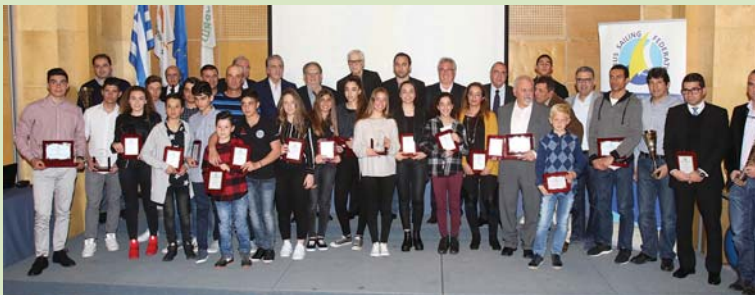
Οι κορυφαίοι ιστιοπλόοι αθλητές για το 2016 στην τελετή που πραγματοποιήθηκε στο Ολυμπιακό Μέγαρο.

Με κάθε επισημότητα και λαμπρότητα πραγματοποιήθηκε στο Ολυμπιακό Μέγαρο στη Λευκωσία η Τελετή Βράβευσης των κορυφαίων αθλητών της Κυπριακής Ιστιοπλοϊκής Ομοσπονδίας (ΚΙΟ) για το 2016. Κορυφαίος ιστιοπλόος για μία ακόμη χρονιά αναδείχθηκε ο Παύλος Κοντίδης ο οποίος κατέλαβε την 7 η θέση στους Ολυμπιακούς του Ρίο και πήρε και το χρυσό στο παγκόσμιο κύπελλο της Μελβούρνης. Δεύτερος κορυφαίος ιστιοπλόος βραβεύτηκε ο Αντρέας Καριόλου και τρίτος ο νεαρός Ορέστης Γερμανός.