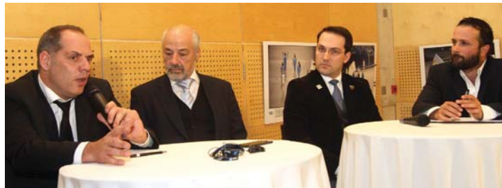
Φωτογραφία από την 28η Σύνοδο της ΕΟΑΚ τον περασμένο Δεκέμβριο