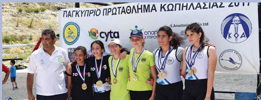
Ο Πρόεδρος της Κυπριακής Ομοσπονδίας Κωπηλασίας Χριστόδουλος Χριστοδούλου κατά την απονομή των μεταλλίων σε νικήτριες του Παγκυπρίου πρωταθλήματος.

Ολοκληρώθηκε το Παγκύπριο Πρωτάθλημα Κωπηλασίας 2016-17, το οποίο διοργάνωσε σε δύο σκέλη η Κυπριακή Ομοσπονδία Κωπηλασίας. Τον τίτλο του πρωταθλητή κατέκτησε ο Ναυτικός Όμιλος Λεμεσού με σύνολο 44 μετάλλια.