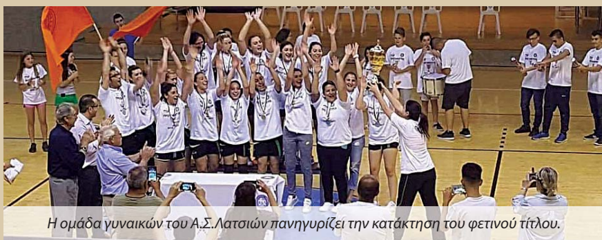
Η ομάδα γυναικών του Α.Σ. Λατσιών πανηγυρίζει την κατάκτηση του φετινού τίτλου.

Με τις απονομές στις πρωταθλήτριες και δευτεραθλήτριες ομάδες ολοκληρώθηκε το Πρωτάθλημα ΟΠΑΠ Ανδρών Α' Κατηγορίας και Γυναικών.