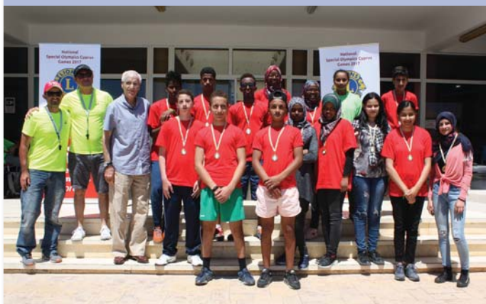
Ο Πρόεδρος της ΚΟΕ Ντίνος Μιχαηλίδης με παιδιά συμμετέχοντες στην ενοποιημένη ημερίδα Floor Ball που έγινε στην Λάρνακα.