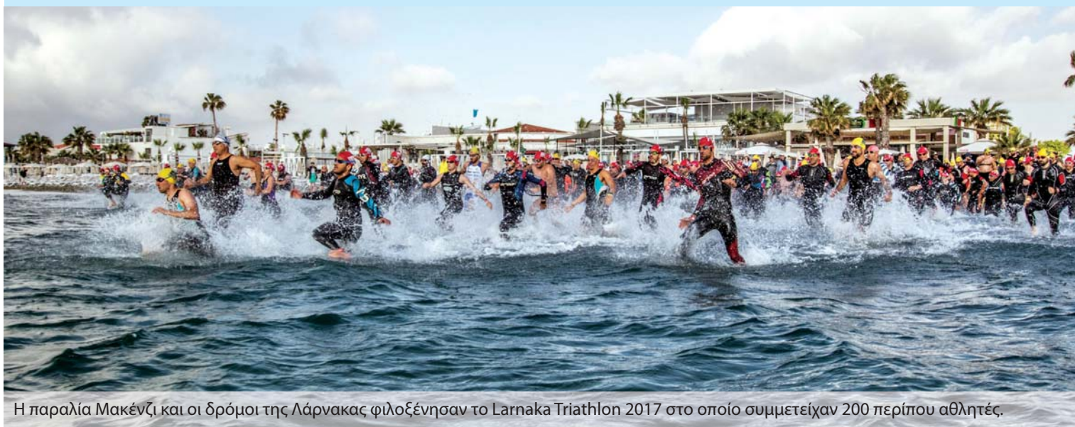
Η παραλία Μακένζι και οι δρόμοι της Λάρνακας φιλοξένησαν το Larnaca Triathlon 2017 στο οποίο συμμετείχαν 200 περίπου αθλητές.

Παλεύοντας με τους ανέμους, 200 περίπου αθλητές αγωνίστηκαν την Κυριακή 7 Μαΐου σε κολύμβηση, ποδηλασία και τρέξιμο. Το Larnaca Triathlon που διεξήχθη για τέταρτη συνεχόμενη χρονιά διοργανώθηκε από τον Τριαθλητικό Όμιλο Νηρέα σε συνεργασία με το Δήμο Λάρνακας. Ο αγώνας εξελίχθηκε στην περιοχή Μακένζι και περιλάμβανε δύο αποστάσεις, Σπριντ (750μ κολύμπι, 20χλμ ποδηλασία, 5 χλμ τρέξιμο) και Τρίαθλον (1500 μ. κολύμπι, 40 χλμ. ποδηλασία, 10 χλμ. τρέξιμο).