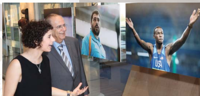
Ο Υπουργός Εξωτερικών επέδειξε ιδιαίτερο ενδιαφέρον για τη δουλειά της φωτογράφου κατά τη ξενάγηση του τη βραδιά των εγκαινίων.