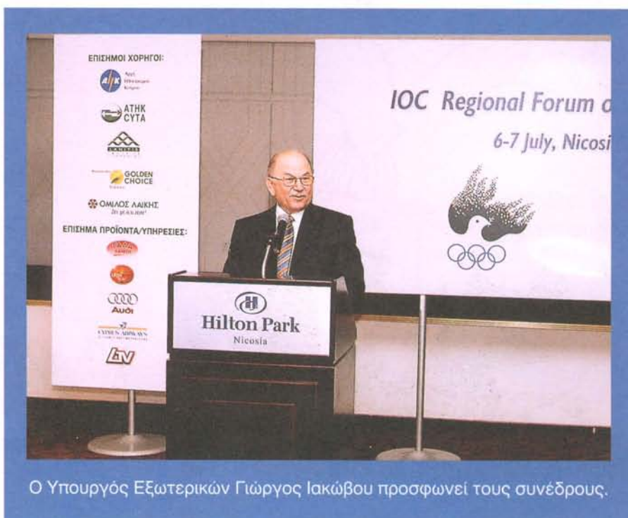
Ο Υπουργός Εξωτερικών Γιώργος Ιακώβου προσφωνεί τους συνέδρους.

Η ΔΟΕ αποφάσισε τη διοργάνωση του συνεδρίου με την ευκαιρία της διέλευσης της Ολυμπιακής Φλόγας από την Κύπρο τον περασμένο Ιούλιο σαν μια συμβολική χειρονομία για την εμπέδωση της ειρήνης και της συναδέλφωσης όλων των λαών.