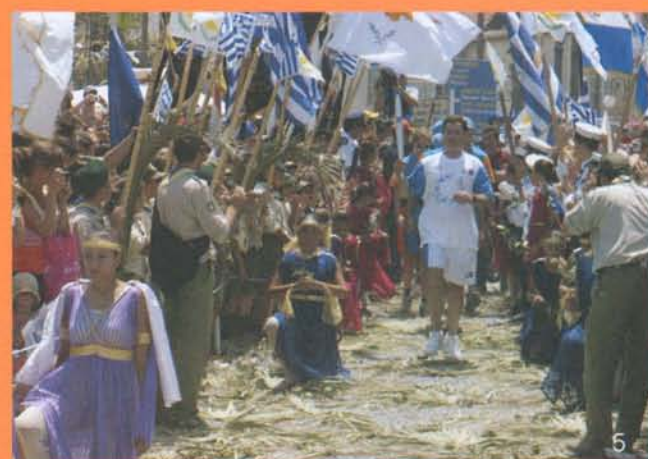
1: Λεμεσός, 2: Λευκωσία, 3: Τάφος Ντ' Αβίλα, 4: Παραλίμνι, 5: Λάρνακα