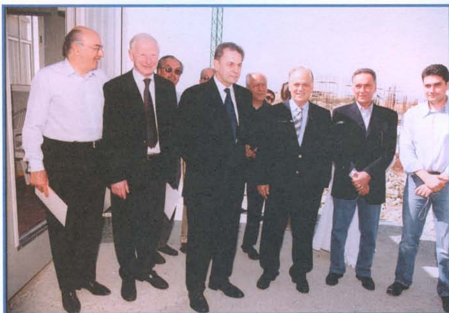
Η επίσκεψη του Jacques Rogge και των άλλων αξιωματούχων της ΔΟΕ στο Ολυμπιακό Μέγαρο και Πάρκο.

Ο Πρόεδρος της ΔΟΕ αποχώρησε από την Κύπρο με τις καλύτερες εντυπώσεις και υποσχέθηκε ότι θα επισκεφθεί ξανά το νησί μας με την πρώτη ευκαιρία.