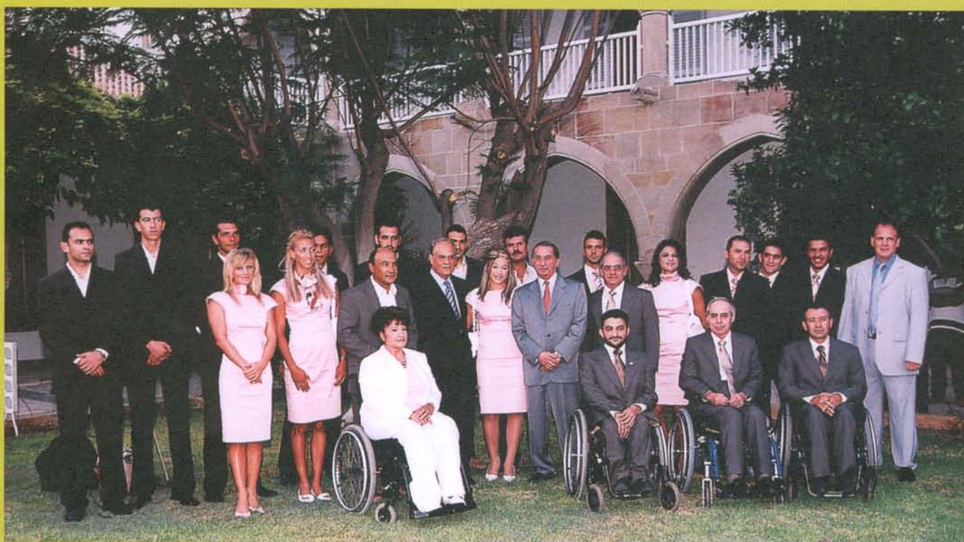
Οι αθλητές της Ολυμπιακής και Παραολυμπιακής Ομάδας με τον Πρόεδρο της Δημοκρατίας.

Σπουδές: Αμερικάνικη Ακαδημία Λευκωσίας (1989-95). Από το 1997 μέχρι σήμερα είναι φοιτητής στο Τμήμα Φυσικής Αγωγής του Πανεπιστημίου Θεσσαλονίκης