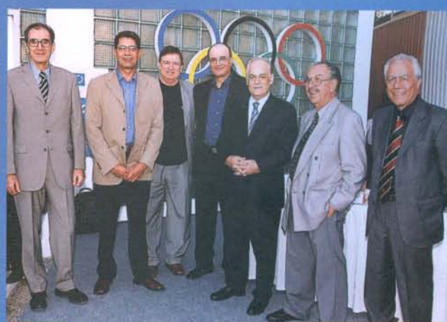
Αθλητές, Χορηγοί και εκπρόσωποι των ΜΜΕ παρευρέθηκαν στη δεξίωση της ΚΟΕ στην Κρατική Έκθεση.