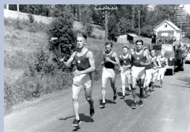
Η πρώτη αφή και λαμπαδηδρομία της Ολυμπιακής Φλόγας έγινε το 1936 ενόψει των Αγώνων στο Βερολίνο. Μεταφέρθηκε δια ξηρής και κάλυψε 3422 χιλιόμετρα, διανύοντας τα Βαλκάνια και την κεντρική Ευρώπη, για να φτάσει στη γερμανική πρωτεύουσα.

Κατά τη διάρκεια των σύγχρονων Ολυμπιακών Αγώνων η φλόγα καίει μέρα και νύκτα σε ειδικό βωμό, συνήθως μέσα στο Ολυμπιακό Στάδιο της πόλης που τους φιλοξενεί, αν και τα τελευταία χρόνια βλέπουμε την πρακτική η Φλόγα να καίει σε κεντρικό σημείο της πόλης. Κάτι που θα συμβεί και το 2020, οπότε η Φλόγα θα τοποθετηθεί σε γέφυρα πεζών στο Tokyo Bay Zone, σε σημείο το οποίο θα λειτουργεί ως μεγάλο υπαίθριο Ολυμπιακό Πάρκο.