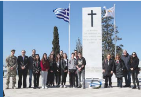
Οι δέκα μαθητές είχαν την ευκαιρία να επισκεφθούν μια σειρά από ιστορικά σημεία αναφοράς στη Λευκωσία και στη Λεμεσό.

κωσία από ξεναγό του Υφυπουργείου Τουρισμού. Επισκέφθηκαν το Παγκύπριο Γυμνάσιο και το εξαιρετικό μουσείο του αρχαιότερου ελληνικού σχολείου στην Κύπρο. Φιλοξενήθηκαν στην Αρχιεπισκοπή, όπου είχαν την ευκαιρία να μάθουν για την πλούσια ιστορία εκκλησίας της Κύπρου. Πήγαν στη Λεμεσό, όπου περιηγήθηκαν στην αναπλασμένη περιοχή του Κάστρου και του Μόλου. Μετέβησαν στα Φυλακισμένα Μνήματα και στον Τύμβο Μακεδονίτισσας, όπου κατέθεσαν στεφάνια και έμαθαν για τους Αγώνες των Κυπρίων το 1955-1959 και το 1974 από εκπρόσωπους του Τμήματος Φυλακών και την Εθνική Φρουρά, που ανέλαβαν τις ξεναγή-