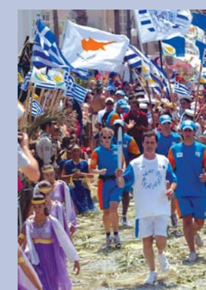
Στις 8 Ιουλίου 2004 η Ολυμπιακή Φλόγα επισκέφθηκε την Κύπρο, στην τελευταία στάση πριν επιστρέψει στην Ελλάδα για το τελικό σκέλος πριν την Αθήνα.