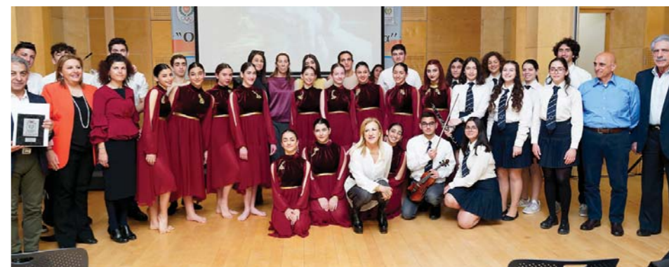
Κάθε σχολείο προσέγγισε διαφορετικά το θέμα, με αποτέλεσμα να απολαύσουμε έξι διαφορετικές παραλλαγές του βασικού θέματος.