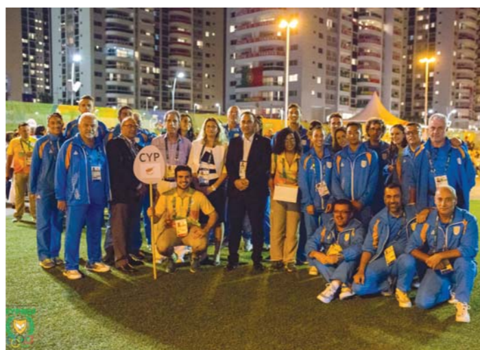
Μέσα στους δέκα περίπου μήνες του προγράμματος, ένα ποσό γύρω στις 300 χιλιάδες ευρώ συγκεντρώθηκε από τις εταιρείες και τους ιδιώτες που στήριξαν το πρόγραμμα, χρήματα που δόθηκαν εξ ολοκλήρου στους Κύπριους αθλητές και αθλήτριες.